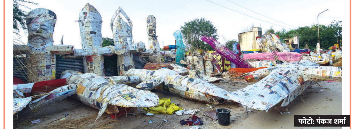
जयपुर। दशहरे के आने में अभी 13 दिन बाकी हैं। चौदहवें दिन रावण दहन किया जाएगा। इस दिन जलाए जाने के लिए पुतले बनाने वाले जोर शोर से जुटे हुए हैं। रावण के पुतले आकार लेने लगे हैं। इन दिनों ये लोग शहर की विभिन्न सड़कों के किनारे पुतले बनाते नजर आ रहे हैं।