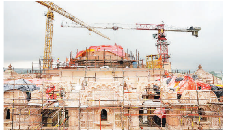
अयोध्या। अयोध्या राम मंदिर में भगवान रामलला की प्राण प्रतिष्ठा के बाद लाखों की संख्या में श्रद्धालु रोजाना दर्शनों के लिए पहुंच रहे हैं। इस बीच राम मंदिर निर्माण के दूसरे चरण का काम भी तेजी से किया जा रहा है। इसमें प्रथम तल का काम तो लगभग पूरा हो गया है। वहीं द्वितीय तल का कार्य तेजी से किया जा रहा है। परकोटा और द्वितीय तल के साथ ही अब शीर्ष तल का स्वरूप भी निखरने लगा। श्रीराम जन्मभूमि ट्रस्ट ने 2025 तक काम को पूरा करने का लक्ष्य रखा है।