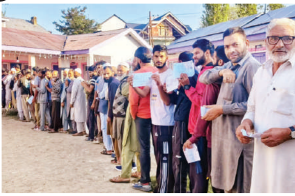
वोट डाले गए। हालांकि पहले चरण की तुलना में इस बार वोटिंग प्रतिशत थोड़ा कम रहा। पहले चरण में 61 फीसदी से अधिक वोटिंग हुई थी।