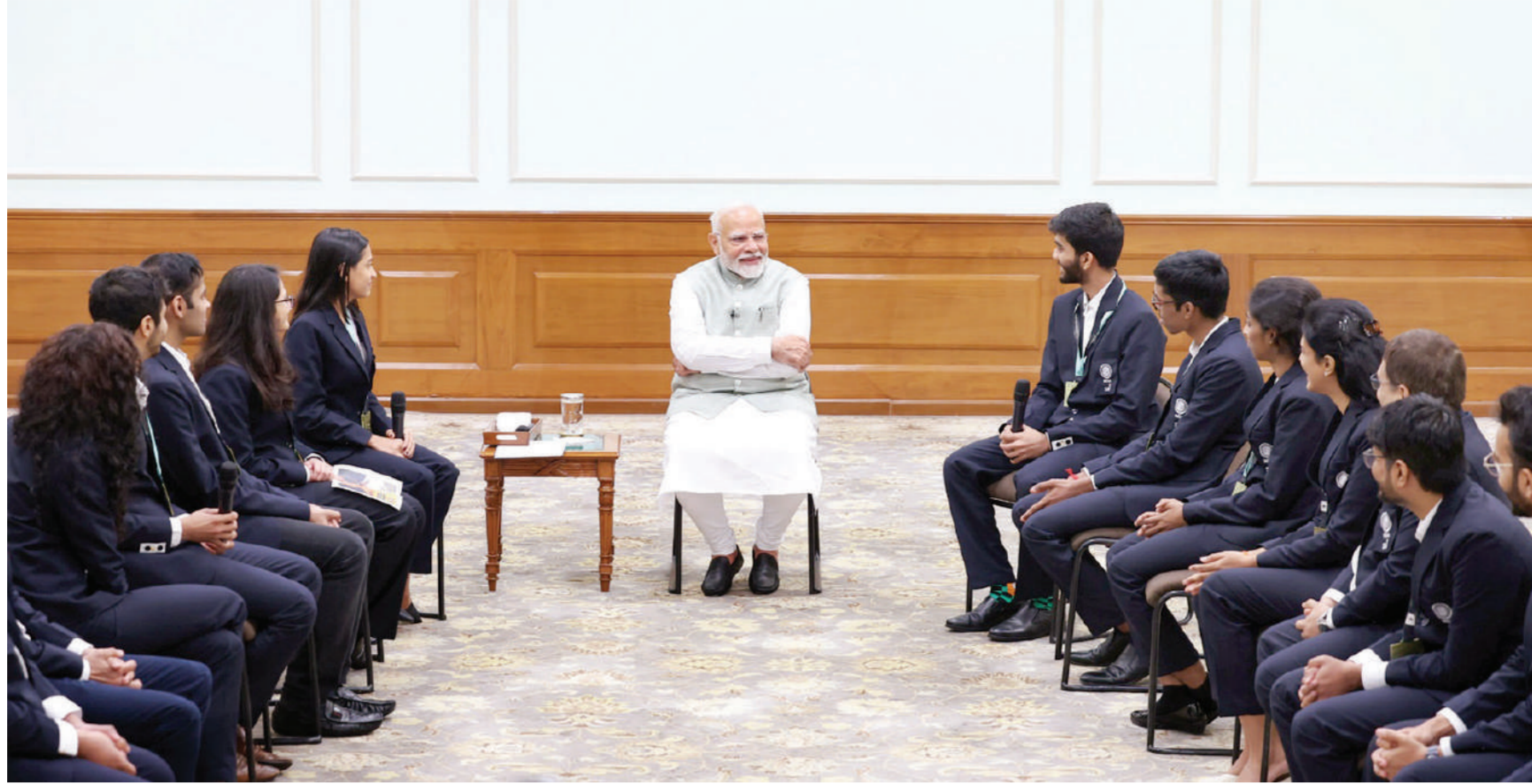
नई दिल्ली। प्रधानमंत्री ने बुधवार को नई दिल्ली में शतरंज ओलंपियाड विजेता भारतीय टीम से मुलाकात की। इस दौरान टीम के सदस्यों के साथ चर्चा करते पीएम मोदी भारत की पुरुष और महिला शतरंज महिला टीम ने रविवार को चेस ओलंपियाड में गोल्ड मेडल जीते। भारत की पुरुष और महिला टीमों ने पहली बार चेस ओलंपियाड में गोल्ड पर कब्जा किया।