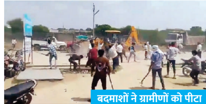
बदमाशों ने ग्रामीणों को पीटा