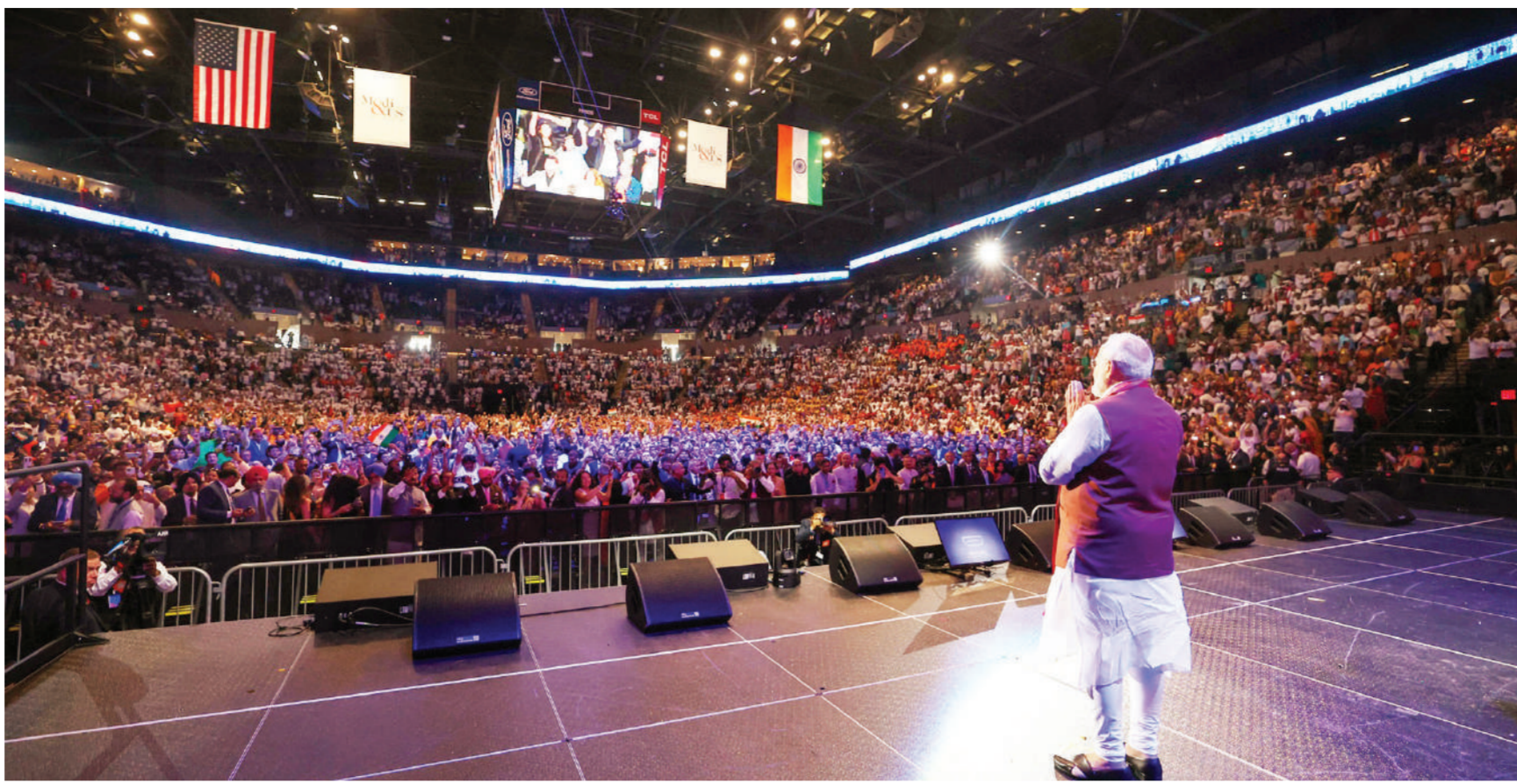
न्यूयॉर्क। प्रधानमंत्री नरेंद्र मोदी ने रविवार को न्यूयॉर्क के नासाऊ कॉलेजियम में भारतीय समुदाय को संबोधित किया। पीएम मोदी ने कहा, 'नमस्ते यूएस! अब हमारा नमस्ते भी ग्लोबल हो गया है। यह सब आपने किया है। आपका प्यार मेरा सौभाग्य है।'