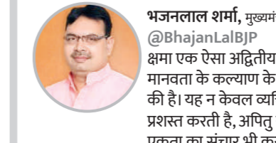
भजनलाल शर्मा, मुख्यमंत्री, राजस्थान @BhajanLalBJP शुभा एक ऐसा अद्वितीय गुण है, जिसने सदियों से मानवता के कल्याण के संकल्प को हृदय प्रदान की है। यह न केवल व्यक्तिगत विकास का मार्ग प्रशस्त करती है, अपितु समाज में सद्भावना और एकता का संचार भी करती है।