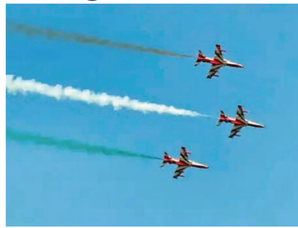
करते हुए 'Y' फॉर्मेशन बनाई। सूर्य किरण एरोबेटिक टीम ने पहली बार जैसलमेर के देदानसर मैदान के ऊपर करतब दिखाए।

बेधड़क। जैसलमेर भारतीय वायुसेना की सूर्य किरण एरोबेटिक टीम ने सोमवार को जैसलमेर के देदानसर मैदान में आसमान में अनेक करतब दिखाए।