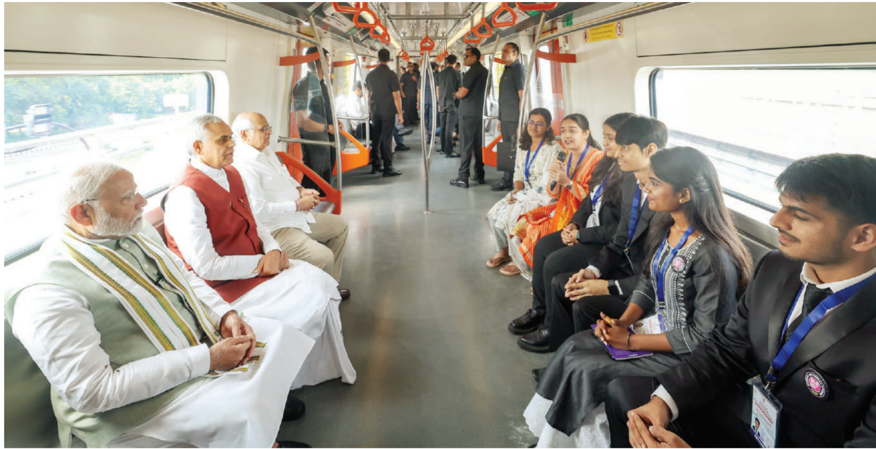
अहमदाबाद। प्रधानमंत्री नरेन्द्र मोदी ने सोमवार को अहमदाबाद में कई विकास परियोजनाओं का लोकार्पण और उद्घाटन किया। उन्होंने अहमदाबाद-भुज मेट्रो ट्रेन को हरी झंडी भी दिखाई। बाद में उन्होंने मेट्रो में सफर भी किया। इस दौरान उन्होंने मेट्रो में सफर कर रहे यात्रियों से भी बातचीत की।