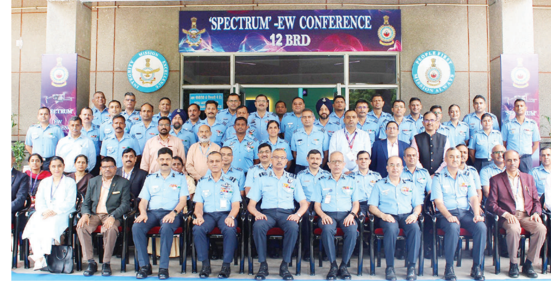
नई दिल्ली। वायु सेना के दिल्ली स्थित नजफगढ़ वायु सेना स्टेशन पर शुक्रवार को आयोजित ई डब्ल्यू कॉन्फ्रेंस स्पेक्ट्रम में आईआईटी, डीआरडीओ व अन्य औद्योगिकी सहभागियों के शिक्षाविद और वैज्ञानिकों ने भाग लिया। इस अवसर एक सामूहिक फोटो में प्रतिभागी।