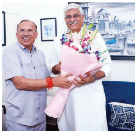
बीएल संतोष और सुनील बंसल से भी की शिष्टाचार

गजेंद्र सिंह शेखावत से उनके निवास पर मुलाकात कर देश-प्रदेश से जुड़े विभिन्न विषयों एवं राजस्थान विधानसभा में किए जा रहे नवाचारों पर चर्चा की। साथ ही उन्हें 'हिंदूवा सूर्य महाराणा प्रताप' पुस्तक भेंट की। देवनानी ने उनसे राजस्थान में पर्यटन विकास की संभावनाओं पर चर्चा की। उन्होंने शेखावत से कहा कि राजस्थान में पर्यटन विकास की दिशा में अधिक कार्य किया जाना चाहिए। इसी तरह अरावली पर्वत श्रृंखला एवं विविध वन्य जीवों एवं वानस्पतिक प्रजातियों से भरपूर अजमेर में भी पर्यटन विकास की विपुल संभावना है। इस दिशा में भी प्रयास किए जाएं।