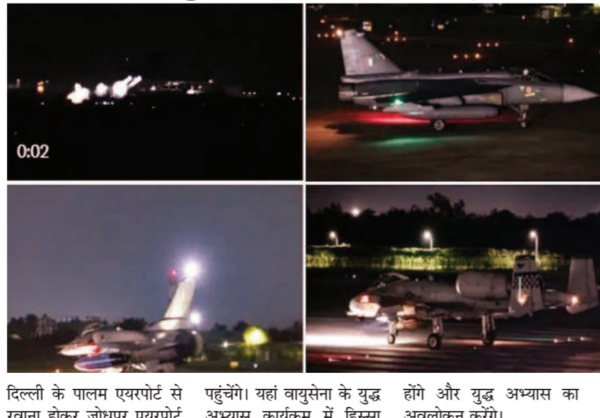
दिल्ली के पालम एयरपोर्ट से पहुंचेंगे। यहां वायुसेना के युद्ध अभ्यास कार्यक्रम में हिस्सा होंगे और युद्ध अभ्यास का अवलोकन करेंगे।

बेधड़क। जोधपुर जोधपुर एयरबेस स्टेशन पर चल रहे युद्धाभ्यास तरंग शक्ति का समापन 14 सितंबर को होगा। इससे पहले वायुसेना स्टेशन पर 12 सितंबर से डिफेंस एक्सपो शुरू होगा। इसमें स्वदेशी लड़ाकू विमान तेजस, लड़ाकू हेलिकॉप्टर प्रचंड व लाइट कॉम्बैट हेलिकॉप्टर ध्रुव शामिल है। साथ ही डीआरडीओ द्वारा अन्य सैन्य सामग्रियों का भी प्रदर्शन किया जाएगा। रक्षा मंत्री राजनाथ सिंह युधवार को तरंग युद्ध शक्ति अभ्यास का निरीक्षण करने के लिए जोधपुर आएंगे। रक्षा मंत्री राजनाथ सिंह 12 सितंबर को सुबह 10 बजे