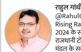
राहुल गांधी, लोकसभा में नेता प्रतिक्रम @RahulGandhi

ट्रंप के पास अवैध प्रवासन से निपटने हेतु दीवार बनाने जैसा एक चिरपरिचित फॉर्मूला है जिससे वे हर रैली में दोहराते हैं तथा बढ़ते अपराध और बेरोजगारी हेतु इन्हीं अवैध प्रवासियों को जिम्मेदार ठहराते हैं। टेक्सास जैसे सीमा पर स्थित राज्यों के लिए यह महत्वपूर्ण मुद्दा है।