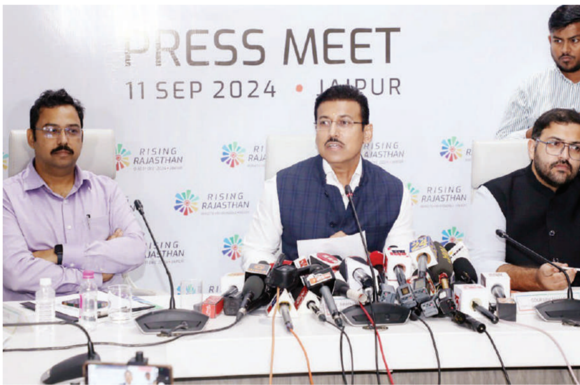
निवेशक अनुकूल बनाने के लिए बड़े पैमाने पर नीतिगत बदलाव कर रही है सरकार

बोले- कारोबार की लागत और लालफीताशाही को कम करना सरकार की प्राथमिकता