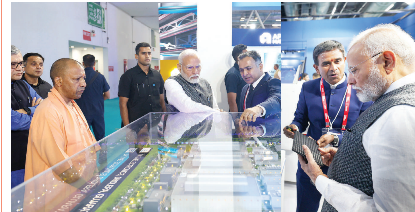
ग्रेटर नोएडा। प्रधानमंत्री नरेंद्र मोदी ने बुधवार को ग्रेटर नोएडा में सेमीकंडक्टर पर आयोजित सेमीकॉन इंडिया 2024 का उद्घाटन किया। इस अवसर पर पीएम मोदी ने वहां लगी प्रदर्शनी का भी अवलोकन किया। प्रदर्शनी के दौरान 26 देशों से आई टीम के प्रतिनिधि पीएम मोदी को सेमीकंडक्टर के बारे में जानकारी देते दिखाई दिए। इस दौरान उत्तर प्रदेश सीएम योगी आदित्यनाथ भी उनके साथ मौजूद रहे।