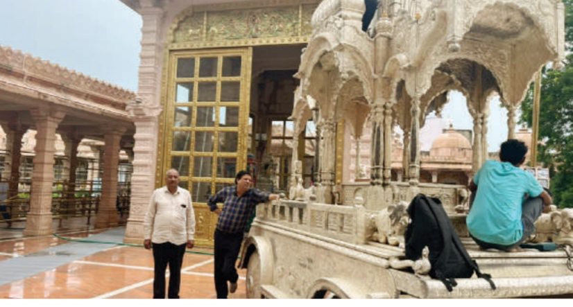
चित्तौड़गढ़ के पास बाईपास से भजन संस्था एवं सांस्कृतिक कार्यक्रम का आयोजन मेला ग्रांड डे मीरा रंगमंच एवं गोवर्धन रंगमंच स्टेज पर आयोजित होगा। रात्रि 9 बजे