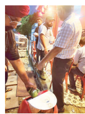
सुल्तान हाउस में मिली सड़ी गली सब्जियां

सुल्तान हाउस, जय सिंह हाईवे पर निरीक्षण किया। यहां पर सड़ी-गली कीड़े लगी हुई सब्जियां रसोई घर में फ्रिज में पाई गईं। उनसे विभिन्न खाद्य पदार्थ तैयार करते हुए पाए गए। डीप फ्रिज में वेज और नॉनवेज आर्टिकल्स भी एक साथ रख पाए। इस पर यहां से विभिन्न खाद्य पदार्थों के नमूने लिए गए। एकस्पायरी ब्रेड के चार पैकेट चार बोतल सांस 4 किलो पत्ता गोभी हरी मिर्च और मांस नष्ट करवाया गया।