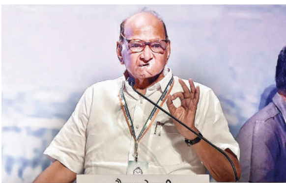
जवाब देते हुए शरद पवार ने कहा, मेरी पार्टी से कोई भी इच्छुक नहीं है। हम किसी को भी सीएम चेहरे के रूप में पेश नहीं कर रहे हैं। शरद पवार ने कहा कि सत्ता परिवर्तन करना हमारी पहली प्राथमिकता है, अगला मुख्यमंत्री कौन होगा, इस पर अभी से सवाल खड़े करने का कोई मतलब नहीं है। हम बस यहां सरकार में बदलाव चाहते हैं क्योंकि हम राज्य को सुशासन देना चाहते हैं। इसलिए, सीएम कौन होगा या नहीं, यह मेरे लिए सवाल नहीं है। ज्ञात रहे कि इससे पहले कांग्रेस ने भी बोल दिया है कि सीएम पद के चेहरे का विषय खत्म हो चुका है और राज्य में कई अन्य मुद्दे हैं।

एजेसी | मुंबई महाराष्ट्र विधानसभा के लिए इस साल के अंत तक होने वाले चुनाव से पहले फिलहाल महा विकास अघाड़ी (एमवीए) के सामने सीएम फेस एक गुत्थी बन गया है। शिवसेना (यूबीटी) नेता उद्धव ठाकरे गठबंधन का सीएम फेस घोषित किए जाने की हिमायत करते रहे हैं। वहीं, शुकुवार को राष्ट्रवादी कांग्रेस पार्टी (एसपी) के अध्यक्ष शरद पवार ने कहा कि हमारी पार्टी में कोई सीएम फेस नहीं है। पवार ने पत्रकारों के सवालों का