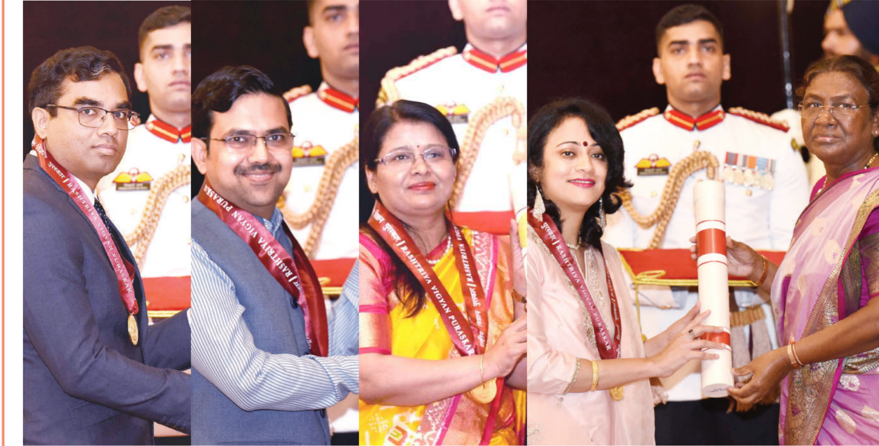
नई दिल्ली। राष्ट्रपति श्रीमती द्रौपदी मुर्मू ने गुरुवार को नई दिल्ली में राष्ट्रपति भवन के गणतंत्र मंडप में आयोजित एक पुरस्कार समारोह में राष्ट्रीय विज्ञान पुरस्कार-2024 प्रदान किए। राष्ट्रीय विज्ञान पुरस्कार के पहले संस्करण में प्रतिष्ठित वैज्ञानिकों को चार श्रेणियों - विज्ञान रत्न, विज्ञान श्री, विज्ञान युवा और विज्ञान टीम में 33 पुरस्कार प्रदान किए गए।