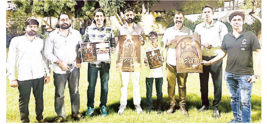
बेधड़क | जयपुर

राजस्थानी फिल्म मेकर भी अब अपनी मूवीज के प्रमोशन को लेकर सजग होने लगे हैं। ऑनलीवुड की तर्ज पर अब वे भी नए-नए तरीके अपना रहे हैं। इसी कड़ी में गुरुवार को 'बरखमा' के मेकर्स अनूठे तरीके से मूवी का ट्रेलर लॉन्च करने जा रहे हैं। इसमें त्रिवेणी चौराहे पर पब्लिक के बीच मूवी का ट्रेलर रिलीज किया जाएगा। इसके बाद टीम रिद्धी सिद्धी चौराहे तक पैदल मार्च निकालेंगी। बता दें कि यह मूवी 6