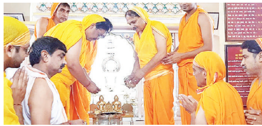
बेधड़क | जयपुर

दिगंबर जैन समाज के लोगों ने जैन धर्म के 12 वें तीर्थंकर भगवान वासूपूज्य का ज्ञान कल्याणक महोत्सव धूमधाम से मनाया। इस मौके पर दिगंबर जैन मंदिरों में पूजा अर्चना के विशेष आयोजन किए गए। इसी के साथ जैन धर्मावलंबियों के षोडशकारण एवं मेघमाला व्रत प्रारंभ होने से दिगंबर जैन मंदिरों में रौनक बढ़ गई है। राजस्थान जैन युवा महासभा जयपुर के प्रदेश