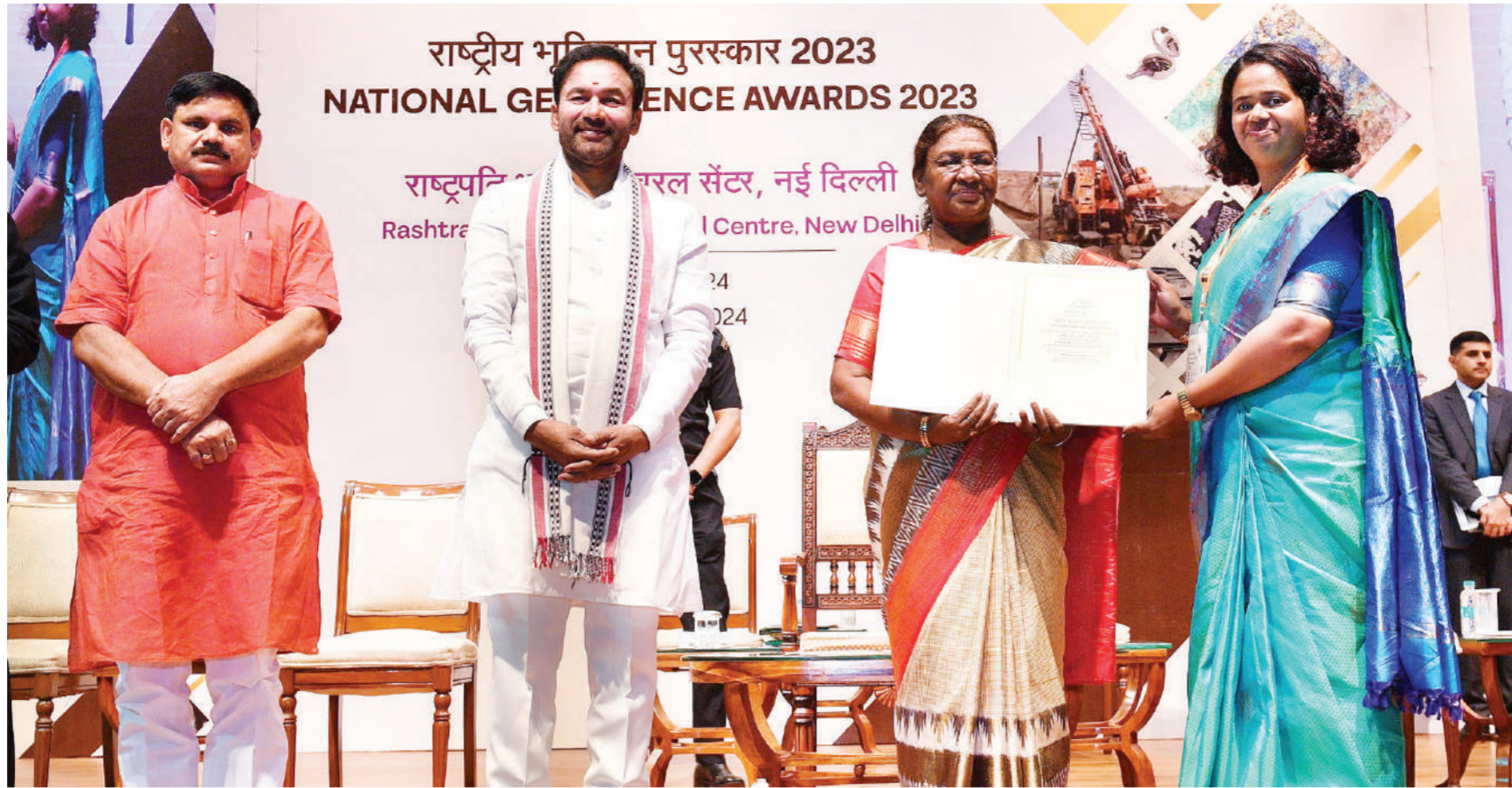
नई दिल्ली। राष्ट्रपति द्रौपदी मुर्मू ने मंगलवार को नई दिल्ली में राष्ट्रपति भवन के सांस्कृतिक केंद्र में आयोजित एक समारोह में राष्ट्रीय भूविज्ञान पुरस्कार-2023 प्रदान किए। इस अवसर उन्होंने कहा कि भारत के 2047 तक विकसित राष्ट्र बनने के लक्ष्य को हासिल करने के लिए खनिज उत्पादन में आत्मनिर्भरता हासिल करना महत्वपूर्ण है।