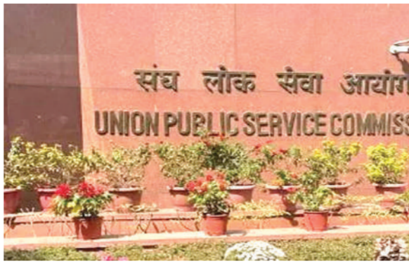
महासचिव जयराम रमेश ने सोशल मीडिया पर साझा एक पोस्ट में

पहल का कांग्रेस समेत कई विपक्षी दलों ने विरोध किया था। बाद में केंद्र सरकार में शामिल राजन के सहयोगी दलों जदयू और लोजपा (रामविलास) ने भी बिना आरक्षण के लेटरल एंट्री पर आपत्ति जताई थी। कांग्रेस ने मंगलवार को कहा कि कांग्रेस अध्यक्ष मल्लिकार्जुन खरेगे, लोकसभा में नेता प्रतिपक्ष राहुल गांधी और अन्य विपक्षी नेताओं के विरोध के कारण ही केंद्र सरकार को 'लेटरल एंट्री' से संबंधित विज्ञापन को निरस्त करने का निर्णय लेना पड़ा। कांग्रेस