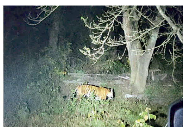
पांच शावक हैं। इनमें बाघ एसटी-2303 भी शामिल है। यह बाघ अब अपनी बाधिन मां से अलग होकर नई टैरिटरी तलाश रहा है। अलवर बफर रेंज में चार बाघ युवा और तीन शावक भी एक

सरिस्का टाइगर रिजर्व युवा बाघों के लिए देश भर में मशहूर रहा है। वर्तमान में यहां 18 शावक हैं और इनमें से ज्यादातर अब युवा अवस्था में पहुंच गए हैं। सरिस्का के अलवर बफर रेंज का बाघ एसटी-2303 भी करीब तीन साल का हो चुका है और यही उम्र है, जब बाघ अपनी नई टैरिटरी बनाता है। यही कारण है बाघ एसटी 2303 इन दिनों सरिस्का की दहलीज लांघ कर हरियाणा के जंगलों में पहुंच गया है। इससे पूर्व भी कई बाघ टैरिटरी की तलाश में सरिस्का के बाहर जा चुके हैं। सरिस्का की अलवर बफर रेंज में इन दिनों 7 बाघ हैं और इनमें