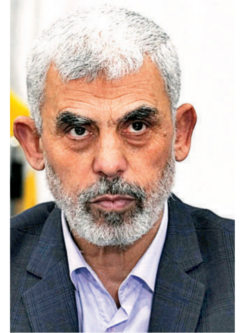
याह्या सिनवार, हमास का नया चीफ।