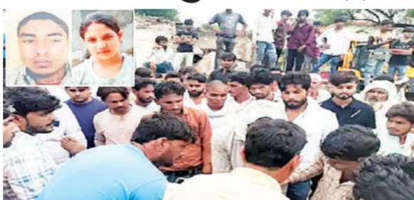
हुआ। पुलिस के अनुसार, सीकर जिले के नीमकाथाना तहसील के

अलवर में रक्षाबंधन के दिन ट्रोले ने बाइक को टक्कर मार दी। टक्कर के बाद ट्रोला चालक दोनों पिता और बेटी को रौंदते हुए करीब 100 मीटर तक सड़क पर घसीटता रहा। हादसे में बाइक सवार पिता-पुत्री की मौत हो गई। पुलिस ने ट्रोले को जप्त कर आरोपी ड्राइवर को गिरफ्तार कर लिया है। यह हादसा तिजारा थाना क्षेत्र के भिंडूसी मेगा हाईवे पर