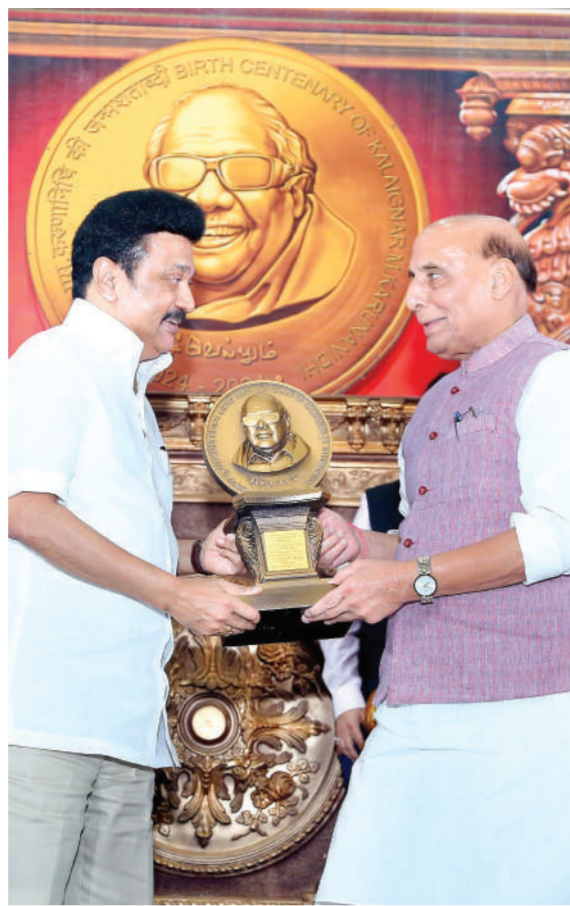
चेन्नई। तमिलनाडु में सतारूद्र द्रविड़ मुनेत्र कथम के पूर्व अध्यक्ष एम करुणानिधि की रविवार को 100वीं पुण्यतिथि मनाई गई। इस अवसर पर चेन्नई में आयोजित एक कार्यक्रम में रक्षा मंत्री राजनाथ सिंह ने राजनाथ सिंह ने करुणानिधि के पुत्र और तमिलनाडु के मुख्यमंत्री एमके स्टालिन की उपस्थिति में 100 रुपए का स्मारक सिक्का जारी किया। सिंह ने कार्यक्रम में अपने संबोधन में करुणानिधि की प्रशंसा की और उन्हें भारतीय राजनीति का एक