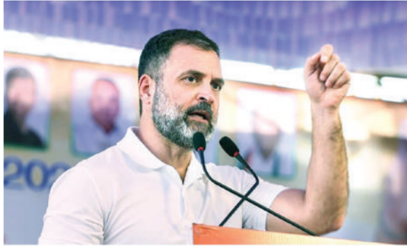
प्रधानमंत्री नरेंद्र मोदी पर एक बार फिर निशाना साधा। राहुल गांधी ने कहा कि यह सरकार बड़े पदों पर भर्ती संघ लोक सेवा आयोग

एजेंसी। नई दिल्ली। संघ लोक सेवा आयोग (यूपीएससी) की लैटरल एंट्री (सीधी भर्ती) के जरिए संयुक्त सचिव, उप सचिव और निदेशक स्तर के 45 पदों पर भर्ती की योजना को लेकर कांग्रेस समेत कई विपक्षी दलों ने केंद्र सरकार पर निशाना साधा है। ये भर्तियां अनुभव और काम के आधार पर होनी हैं। कांग्रेस सांसद और लोकसभा में विपक्ष के नेता राहुल गांधी, राजद नेता तेजस्वी यादव और बसपा प्रमुख मायावती ने