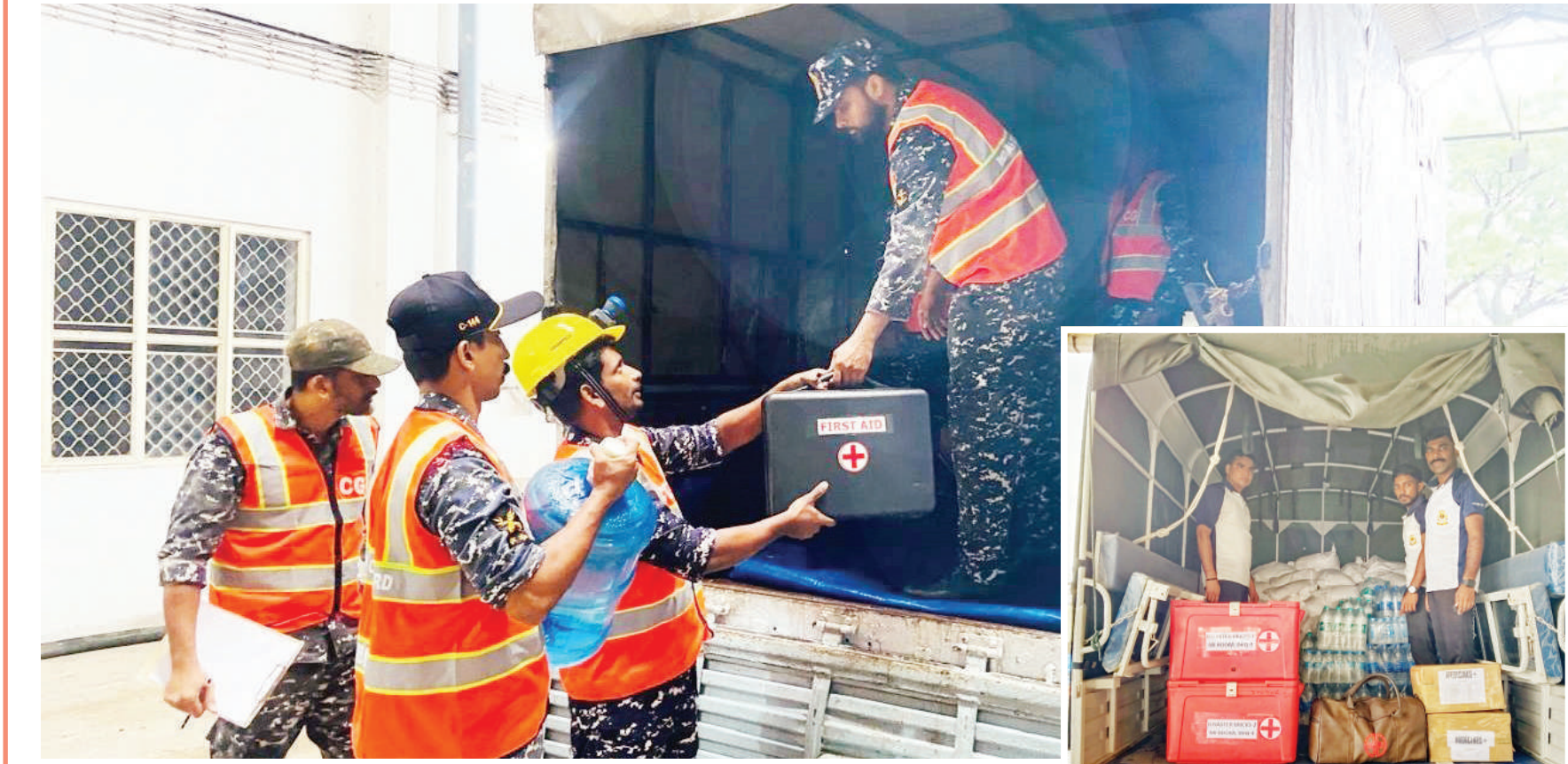
वायनाड। केरल के वायनाड में ऊंचाई पर स्थित गांवों में मंगलवार को बड़े पैमाने पर हुई भूस्खलन की घटनाओं के बाद प्रभावित इलाकों तक सेना व एनडीआरएफ समेत कई टीमों राहत व बचाव अभियान में जुटी हुई हैं। प्रभावित इलाकों में तत्काल राहत पहुंचाने के लिए आईसीजी ने कई आपदा राहत टीमों सक्रिय की और मौके पर राहत सामग्री पहुंचाई गई।