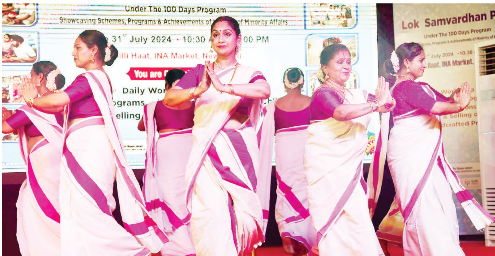
नई दिल्ली। अल्पसंख्यक मामलों के मंत्रालय द्वारा रविवार को नई दिल्ली में लोक कल्याण पर्व का आयोजन किया गया। इस दौरान सांस्कृतिक कार्यक्रम प्रस्तुत किए गए। केंद्रीय अल्पसंख्यक और मत्स्यपालन विभाग के राज्य मंत्री जॉर्ज कुरियन भी इस अवसर पर उपस्थित थे।