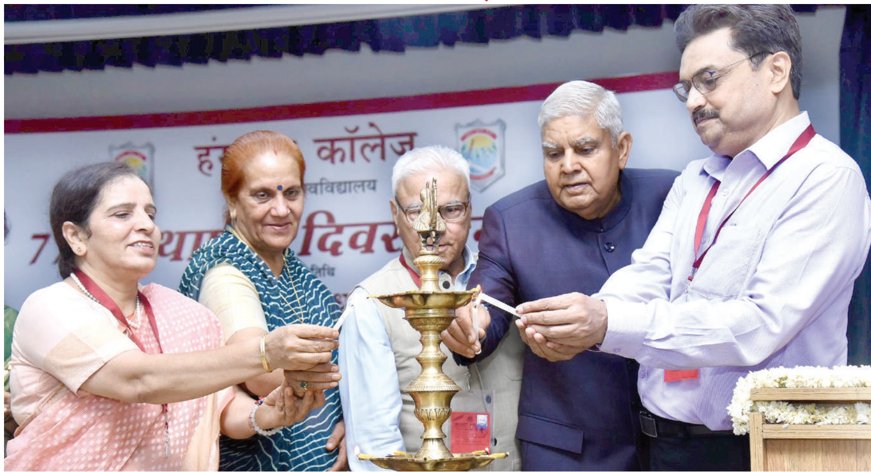
नई दिल्ली। उप राष्ट्रपति जगदीप धनखड़ ने शुक्रवार को दिल्ली विश्वविद्यालय के हंसराज कॉलेज के 77 वें स्थापना दिवस समारोह की दीप प्रज्वलित कर शुरुआत की।