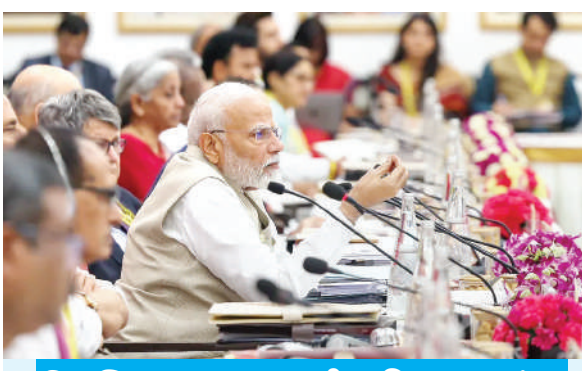
विकसित भारत हर भारतीय की महत्वाकांक्षा

प्रधानमंत्री नरेंद्र मोदी ने शनिवार को कहा कि भारत सही दिशा में चल रहा है और आज देश के लोगों में आत्मविश्वास झलक रहा है। 2047 तक विकसित भारत के लक्ष्य को हासिल किया जा सकता है और इसके लिए राज्यों की भागीदारी महत्वपूर्ण है। उन्होंने कहा कि यह दशक बदलावों, तकनीकी व भू-राजनीतिक बदलावों और अवसरों का है। भारत को इन अवसरों का लाभ उठाना चाहिए और अपनी नीतियों को अंतरराष्ट्रीय निवेश के अनुकूल बनाना चाहिए। यह भारत को विकसित राष्ट्र बनाने की दिशा में प्रगति की सीढ़ी है। पीएम मोदी ने नीति आयोग की संचालन परिषद की नौवीं बैठक को संबोधित करते हुए यह बात कही। प्रधानमंत्री ने बैठक की अध्यक्षता की। पीएम ने हमने 100 साल में एक बार आने वाली महामारी को हराया है। उन्होंने कहा कि भारत एक युवा देश है। यह अपने कार्यबल के कारण पूरी दुनिया के लिए एक बड़ा आकर्षण है। हमें अपने युवाओं को एक कुशल और रोजगार योग्य कार्यबल बनाने का लक्ष्य रखना चाहिए। विकसित भारत बनाने के लिए स्किल, रिसर्च, इनोवेशन और नौकरी आधारित ज्ञान पर जोर देना जरूरी है।