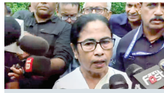
ममता को पहले बुलाया गया था

पश्चिम बंगाल की मुख्यमंत्री ममता बनर्जी शनिवार को यहां प्रधानमंत्री नरेंद्र मोदी की अध्यक्षता में हुई नीति आयोग की बैठक से बाहर चली गईं और दावा किया कि विपक्ष को एकमात्र प्रतिनिधि होने के बावजूद उन्हें भाषण के बीच में गलत तरीके से रोका गया। हालांकि, सरकारी सूत्रों ने उनके दावे को खारिज कर दिया और कहा कि उनके बोलने का समय समाप्त हो गया था। बनर्जी ने कहा कि उनका माइक्रोफोन पांच मिनट के बाद बंद कर दिया गया, जबकि अन्य मुख्यमंत्रियों को अधिक देर तक बोलने की अनुमति दी गई।