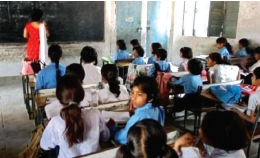
भर्तियों में बड़े पैमाने पर गड़बड़ी!

जयपुर। प्रदेश में कांग्रेस सरकार के पांच साल के कार्यकाल के दौरान भर्ती होने वाले शिक्षकों की मुश्किलें बढ़ने वाली हैं। दरअसल, सरकार ने एक लाख शिक्षकों के दस्तावेजों की जांच करवाने का फैसला किया है। इतना ही नहीं, सहायक पुलिस उप निरीक्षक भर्ती पेपर लीक मामले में अब प्रवर्तन निदेशालय (ईडी) ने भी जांच शुरू कर दी है। इससे पहले ईडी शिक्षक भर्ती पेपर लीक मामले की भी जांच कर रहा है। राज्य में प्रारंभिक यूनिवर्सिटीज से फर्जी डिग्रियां जारी होने का मामला सामने आने के बाद राज्य सरकार ने पिछले पांच साल में नियुक्ति पाने वाले करीब एक लाख शिक्षकों के दस्तावेजों की फिर से जांच कराने का निर्णय किया है। सरकार ने तय किया है कि शिक्षकों की डिग्रियों की सत्यता जांचने के लिए सरकारी अधिकारियों की टीम विश्वविद्यालयों में जाकर भी वहां के रिकॉर्ड को भी खंगालेगी। बता दें कि भाजपा के सत्ता में आने के बाद पिछले आठ महीने में की गई जांच में यह सामने आया है कि पूर्ववर्ती कांग्रेस सरकार के कार्यकाल के दौरान भर्ती परीक्षाओं में बड़े पैमाने पर गड़बड़ियां हुई थीं। कई परीक्षाओं के पेपर लीक हुए थे तो कहीं फर्जी दस्तावेजों के आधार पर नियुक्तियां हो गईं। सबसे अधिक फर्जीवाड़ा तृतीय श्रेणी के शिक्षकों की भर्ती में हुआ। पिछले दिनों राजस्थान एसओजी ने फर्जी डिग्रियां देने वाले दो निजी विश्वविद्यालयों के संचालकों को गिरफ्तार किया था। दोनों ने बड़े पैमाने पर फर्जी डिग्रियां देने की बात स्वीकार भी की है।