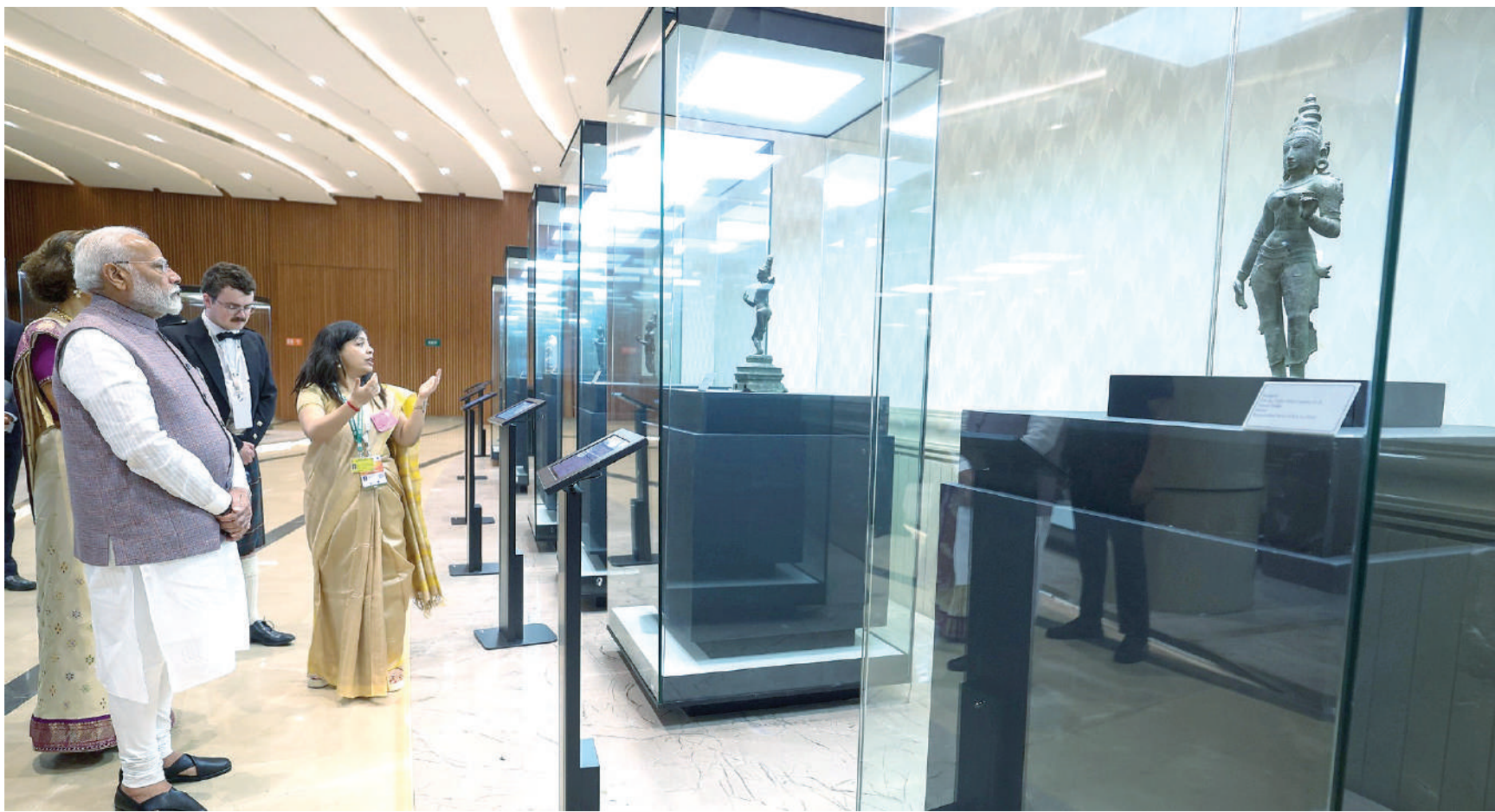
नई दिल्ली। प्रधानमंत्री नरेंद्र मोदी ने रविवार को नई दिल्ली में भारत मंडप में आयोजित विश्व विरासत समिति के 46वें सत्र का उद्घाटन किया। इस अवसर पर पीएम मोदी रिटर्न ऑफ ट्रिजर्स प्रदर्शनी का अवलोकन करते हुए।