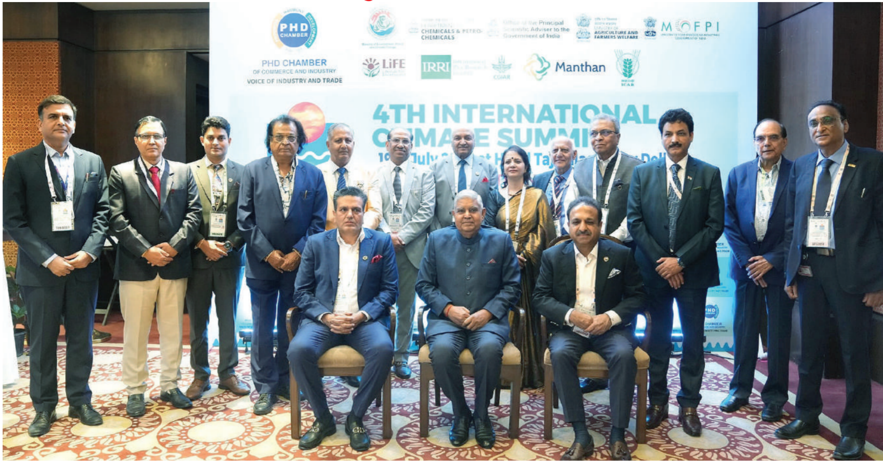
नई दिल्ली। उपराष्ट्रपति जगदीप धनखड़ ने शुक्रवार को पीएचडी चैंबर ऑफ कॉमर्स एंड इंडस्ट्री की ओर से आयोजित अंतरराष्ट्रीय जलवायु शिखर सम्मेलन में भाग लिया। उन्होंने सम्मेलन के समापन सत्र को संबोधित भी किया। इस अवसर पर प्रतिभागियों के साथ उपराष्ट्रपति धनखड़।