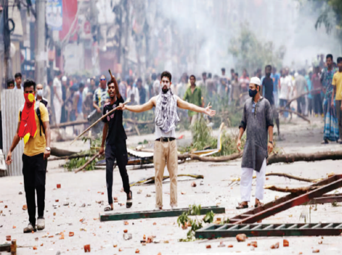
एजेंसी | ढाका

हिंसा में मरने वालों की संख्या बढ़ी ■ मृतकों की संख्या हुई 115 ■ भारत लौटने वालों की संख्या हुई 998