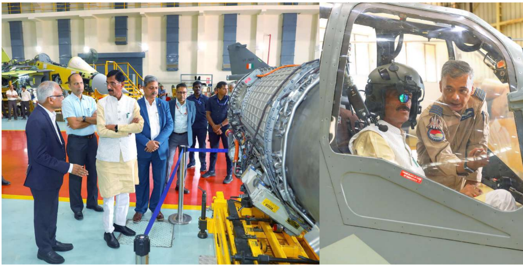
बेंगलुरु। रक्षा राज्य मंत्री संजय सेठ ने सोमवार को कर्नाटक के बेंगलुरु स्थित हिंदुस्तान एयरोनॉटिक्स लिमिटेड (एचएएल) और बीईएमएल लिमिटेड की कार्यशालाओं का दौरा किया। उन्होंने दोनों रक्षा क्षेत्र के लिए सार्वजनिक उपक्रमों द्वारा किए जा रहे विकास कार्यों की समीक्षा की। चित्रों में एचएएल के टैरि के दौरान सेठ को वहां की विभिन्न गतिविधियों की जानकारी दी गई। जिसमें विमान उन्नयन, एवियोनिक्स विकास, निर्यात, इंजन उत्पादन, मानवयुक्त तथा मानवरहित हवाई वाहनों के बारे में जानकारी शामिल है।