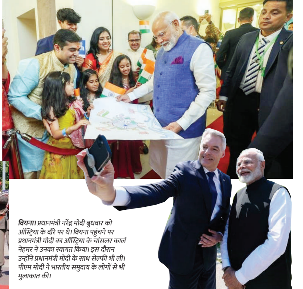
वियना। प्रधानमंत्री नरेंद्र मोदी बुधवार को ऑस्ट्रिया के दौरे पर थे। वियना पहुंचने पर प्रधानमंत्री मोदी का ऑस्ट्रिया के चांसलर कार्ल नेहमर ने उनका स्वागत किया। इस दौरान उन्होंने प्रधानमंत्री मोदी के साथ सेल्फी भी ली। पीएम मोदी ने भारतीय समुदाय के लोगों से भी मुलाकात की।