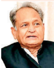
अशोक गहलोत, पूर्व मुख्यमंत्री

'हमारी सरकार ने मिशन-2030 के तहत राजस्थान को नंबर 1 बनाने का लक्ष्य रखा था। आशा थी कि हमारी सरकार जाने के बाद भाजपा सरकार कम से कम राजस्थान की बेहतरी के लिए इस मिशन को ध्यान में रखकर काम करेगी और विकास की बेहतरीन योजनाएं लाएगी। राजस्थान सरकार की ओर से लाए गए बजट का शिक्षा, स्वास्थ्य और सामाजिक सुरक्षा से कोई संरोक नहीं लगता है। बजट से न जनता को राहत मिली है और ना ही कोई विकास का रोजमैप बन रहा है। पिछले 10 साल से जैसा केंद्र सरकार का बजट नीस एवं दिशाहीन होता है। यह दिखाता है कि ये सरकार काम में नहीं सिर्फ पैकेजिंग में भरोसा करती है।