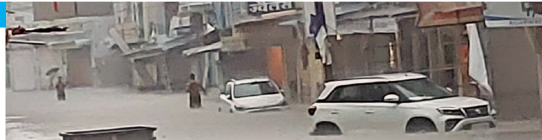
टोंक: जिला मुख्यालय से 50 गांवों का टूटा संपर्क

पूर्वी राजस्थान के कुछ भागों में 6 जुलाई को भी बारिश की गतिविधियां जारी रहने व कहीं-कहीं भारी बारिश होने की संभावना है। 7-8 जुलाई को भारी बारिश की गतिविधियों में कमी होने तथा उत्तर-पूर्वी राजस्थान के कुछ भागों में बारिश दर्ज होने की संभावना है। इसके बाद 9-10 जुलाई से पुनः पूर्वी राजस्थान में बारिश की गतिविधियों में बढ़ोतरी होने की संभावना है। पश्चिमी राजस्थान के बीकानेर संभाग में आगामी 2-3 दिन दोपहर बाद मेघगर्जन, आंधी के साथ बारिश होने की संभावना है। जोधपुर संभाग के पूर्वी व उत्तरी भागों में कहीं-कहीं बारिश की संभावना है।