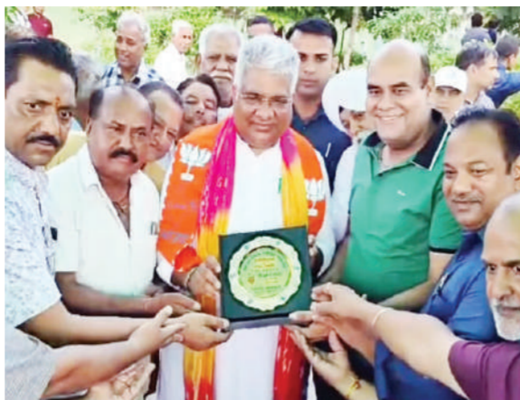
इसके लिए नई जेसीबी मंगवाई गई है, जो कि 8 जुलाई तक अलवर में पहुंचकर सफाई की व्यवस्था को संभालेगी। केन्द्रीय मंत्री यादव ने कहा कि आगामी 8 जुलाई से जेसीबी से शहर के नालों को सफाई कराई जाएगी। इसके लिए सभी पार्श्वों का सोशल मीडिया पर ग्रुप बनाया जाए, जिससे नालों को सफाई करवाई जा सके। केन्द्रीय मंत्री ने कहा कि अलवर में सबसे बड़ी चुनौती प्लास्टिक का बढ़ता उपयोग एवं अतिक्रमण है। इस पर रोक लगाने की जरूरत है। उन्होंने कहा कि पुरानी ड्रेनेज सिस्टम को रिस्थापना जाएगा। जहां-जहां पानी रुकता है उन जगहों पर जेसीबी से खुदाई करवाई जाएगी।

बेधड़क। जयपुर केन्द्रीय वन एवं पर्यावरण मंत्री और अलवर के सांसद भूपेन्द्र यादव ने शुक्रवार को जिला कलेक्टर के साथ सभी विभागों के अधिकारियों की बैठक बुलाई। इसमें नगर निगम के मेयर भी मौजूद रहे। बैठक में नगर निगम, पीडब्ल्यूडी और अन्य विभागों के कामकाज की समीक्षा की गई। उन्होंने कहा कि इस बार मानसून में बारिश होना अच्छा है, लेकिन बारिश के इंतजार के साथ इंतजाम भी बहुत जरूरी है। केन्द्रीय मंत्री भूपेन्द्र यादव ने कहा कि अलवर में नाला सफाई बड़ी समस्या है।