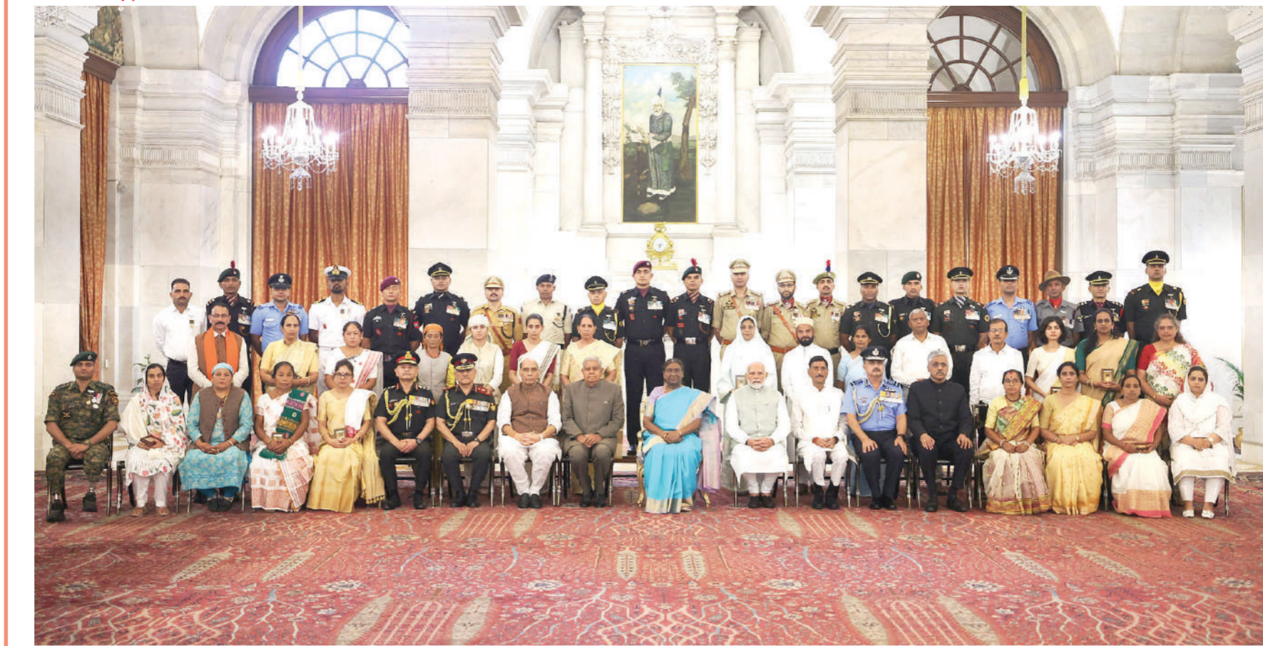
नई दिल्ली। राष्ट्रपति द्रौपदी मुर्मू ने मातृभूमि की रक्षा करते हुए सशस्त्र बलों, केन्द्रीय पुलिस बलों और राज्य पुलिस बलों के सर्वोच्च बलिदान देने वाले 36 जांबाजों को वीरता पदकों से सम्मानित किया। दस जांबाजों को कीर्ति चक्र तथा 26 को शौर्य चक्र प्रदान किए गए। सात कीर्ति चक्र और सात शौर्य चक्र मरणोपरांत दिए गए।