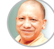
योगी आदित्यनाथ, मुख्यमंत्री, उत्तर प्रदेश @myogadityanath