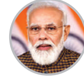
नरेंद्र मोदी, प्रधानमंत्री @narendramodi

आओ रानी, हम दोंयेंगे पालकी, यही हुई है राय जवाहरलाल की रफू करंगे फटे-पुराने जाल की आओ रानी, हम दोंयेंगे पालकी! बाबा नागार्जुन एक प्रतिबद्ध कवि थे। और उनकी यह प्रतिबद्धता जनता के प्रति थी। कविता में वे अपनी प्रतिबद्धता को कुछ इस तरह से व्यक्त करते थे। 1975 में तत्कालीन प्रधानमंत्री इंदिरा गांधी ने देश में आपातकाल लगाया। समाजवादी लीडर जयप्रकाश नारायण के नेतृत्व में एक जबर्दस्त आंदोलन हुआ। जिसमें देशभर के लोग सत्ता की बर्बरता के खिलाफ लामबंद हुए, इन हालात पर नागार्जुन ने सत्ता के शीर्ष पद पर बैठी नेता की भी अपनी कविताओं से खूब आलोचना की। बाबा नागार्जुन की कविताओं में जिंदगी के कई रंग और उतार-चढ़ाव देखने को मिलते हैं। अकाल के दिनों में लिखी उनकी कविता में आम आदमी की बदहाल जिंदगी और उसके जीवन का जो संघर्ष दिखाई देता है, ऐसा हिंदी कविता में विरल है। (ये लेखक के निजी विचार हैं)