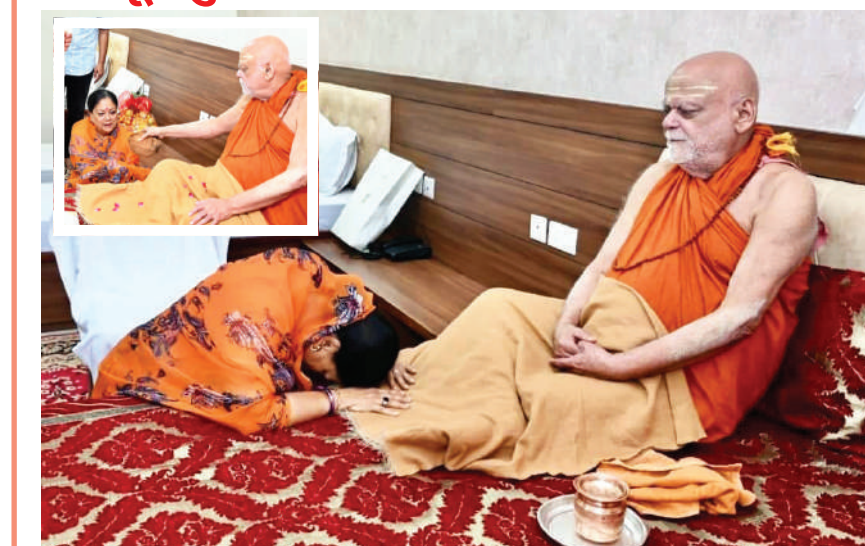
जयपुर। राजधानी के माहेश्वरी सभा भवन में राष्ट्रोत्कर्ष दिवस के आयोजन के अवसर पर शंकराचार्य स्वामी निश्चलानन्द सरस्वती महाराज के 82वें प्राकट्य महोत्सव कार्यक्रम में पूर्व मुख्यमंत्री वसुंधरा राजे ने पहुंच कर आशीर्वाद लिया।

भारी वर्षा के बाद राहत कार्यों की मुख्य सचिव ने की समीक्षा बारिश के मौसम में प्रशासनिक अधिकारी रहें अलर्ट