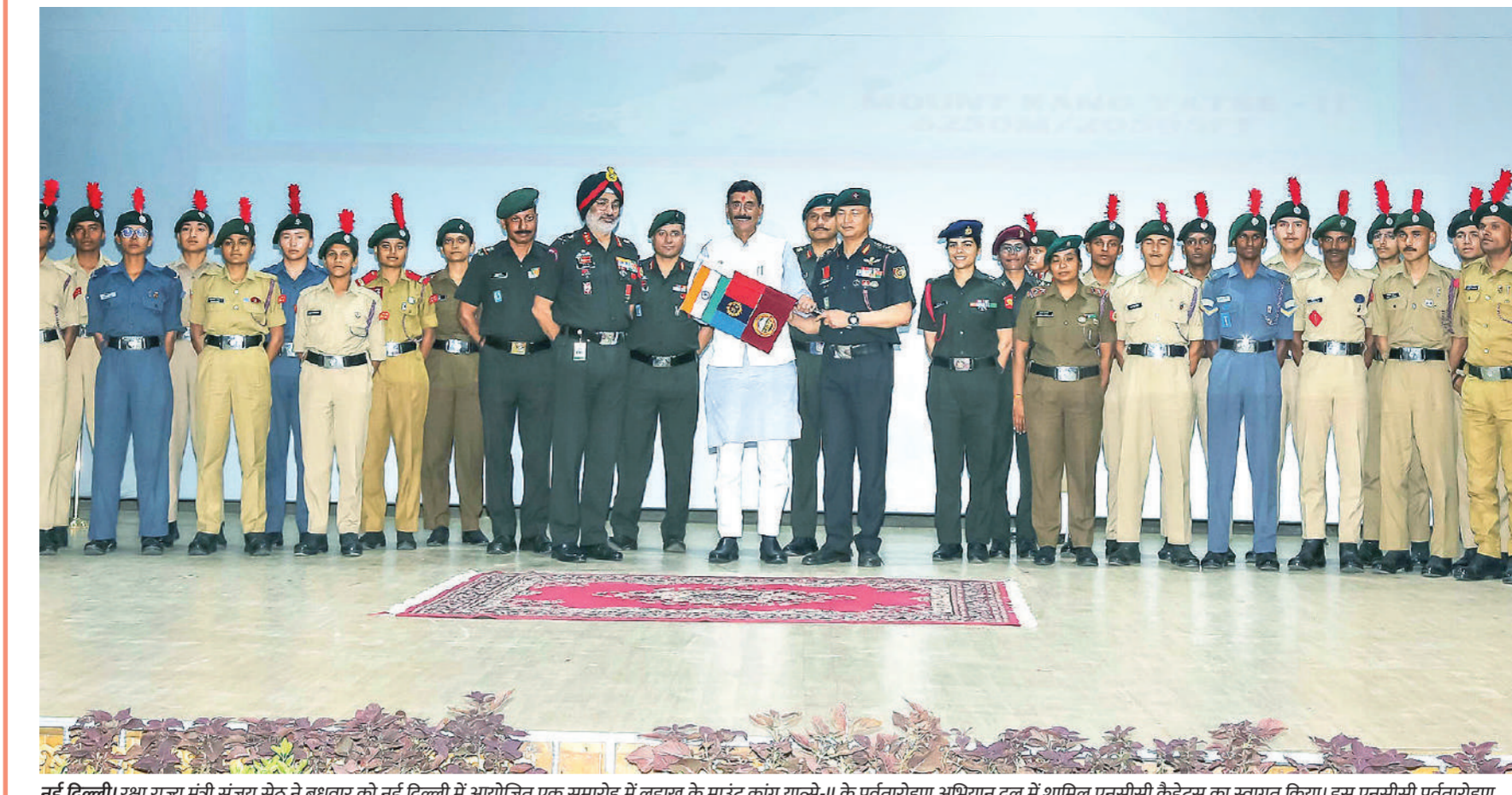
नई दिल्ली। रक्षा राज्य मंत्री संजय सेठ ने बुधवार को नई दिल्ली में आयोजित एक समारोह में लद्दाख के माउंट कांग यात्से-II के पर्वतारोहण अभियान दल में शामिल एनसीसी कैडेट्स का स्वागत किया। इस एनसीसी पर्वतारोहण अभियान दल में 27 गर्ल और बॉय कैडेट्स, 5 अधिकारी और 17 प्रशिक्षक कर्मचारी शामिल थे।