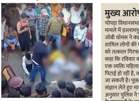
कुछ समय में हुई ऐसी ही जघन्य घटनाओं से सबक नहीं सीखा है। आयोग ने यह भी कहा कि एनएचआरसी पहले ही ऐसी गंभीर घटनाओं को लेकर चिंता का इजाजत कर चुका है।

पश्चिम बंगाल के उत्तरी दिनाजपुर जिले में कथित अवैध संबंध के आरोपी युगल की पिटाई के मामले में राष्ट्रीय मानवाधिकार आयोग ने स्वतः सज्ञान लिया है। आयोग ने कहा है कि पश्चिम बंगाल के पुलिस महानिदेशक और राज्य सरकार के मुख्य सचिव से एक हफ्ते के भीतर जवाब मांगा गया है। मामले की गंभीरता को देखते हुए जांच के लिए एक टीम भेजने का फैसला लिया गया है। आयोग ने कहा कि दिनदहाड़े युगल को बेहमी से पीटे जाने की घटना से ऐसा लगता है कि राज्य के संबंधित अधिकारियों ने पिछले