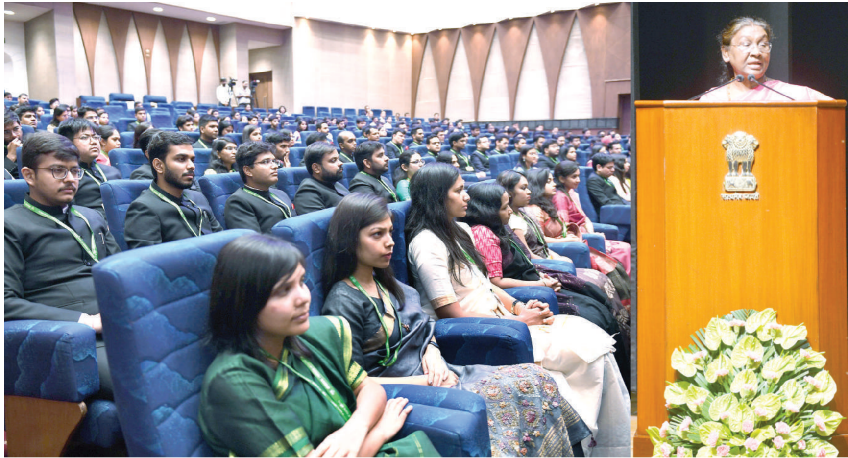
नई दिल्ली। भारतीय प्रशासनिक सेवा के 2022 के बैच के सहायक सचिवों के एक दल ने सोमवार को नई दिल्ली में राष्ट्रपति भवन में राष्ट्रपति द्रौपदी मुर्मू से भेंट की। इस मौके पर राष्ट्रपति ने उनको संबोधित भी किया।