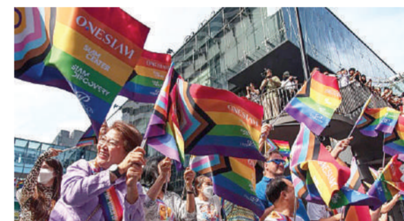
देश बन गया। मालूम हो कि अब इस विधेयक को थाईलैंड के राजा की औपचारिक स्वीकृति मिलने की आवश्यकता है, जिसके बाद

थाईलैंड की संसद ने मंगलवार को समलैंगिक विवाह को कानूनी मान्यता देने वाले एक विधेयक को पारित कर दिया। ताइवान और नेपाल के बाद थाईलैंड समलैंगिक विवाह को अनुमति देने वाला एशिया का तीसरा देश बन गया है। विधेयक को भारी मतों से पारित करने के साथ ही थाईलैंड समलैंगिक जोड़ों को मान्यता देने वाला दक्षिण-पूर्वी एशिया का इकलौता