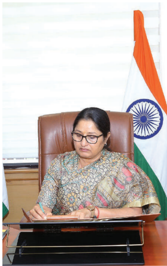
नई दिल्ली। प्रधानमंत्री नरेंद्र मोदी द्वारा केंद्रीय मंत्रिमंडल में शामिल मंत्रियों को विभागों के आर्बन के बाद मंगलवार को कई मंत्रियों में अपना कार्यभार संभाल लिया। केंद्रीय महिला व बाल विकास मंत्री अन्नपूर्णा देवी, रसायन एवं उर्वरक राज्य मंत्री अनुपमिया पटेल एवं महिला एवं बाल विकास राज्य मंत्री सावित्री ठाकुर अपने-अपने मंत्रालय का कार्यभार संभालते हुए।