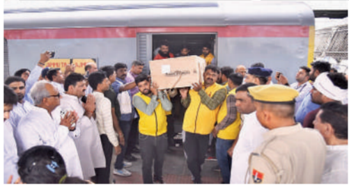
मुआवजा और दो जनों को संविदा पर नौकरी दी जाएगी। साथ ही एक डेयरी बूथ भी अलॉट किया जाएगा। इसके बाद चारों शवों का अंतिम संस्कार किया गया। उल्लेखनीय है कि जम्मू

आतंकी हमले में मारे गए थे एक ही परिवार के 4 सदस्य