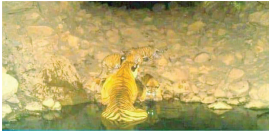
भी आसानी से होंगे। सरिस्का की अकबरपुर रेंज में बाघिन एसटी-17 के साथ कैमरा ट्रैप में तीन नए शावक दिखाई दिए हैं। सरिस्का में पिछले 4 महीने में 13 नए शावक मिले हैं। इससे पहले 13 मार्च को

बेधड़क। अलवर टाइगर रिजर्व सरिस्का से वन्यजीव प्रेमियों के लिए फिर खुशी वाली खबर मिली है। अब बाघिन एसटी-17 के साथ तीन नए शावक अकबरपुर रेंज में कैमरा ट्रैप में दिखाई दिए हैं। सरिस्का में बाघों का कुनबा बढ़ कर अब 43 का हो गया है, सरिस्का में अब 11 मेल टाइगर, 14 फीमेल टाइगर और 18 शावक हैं।