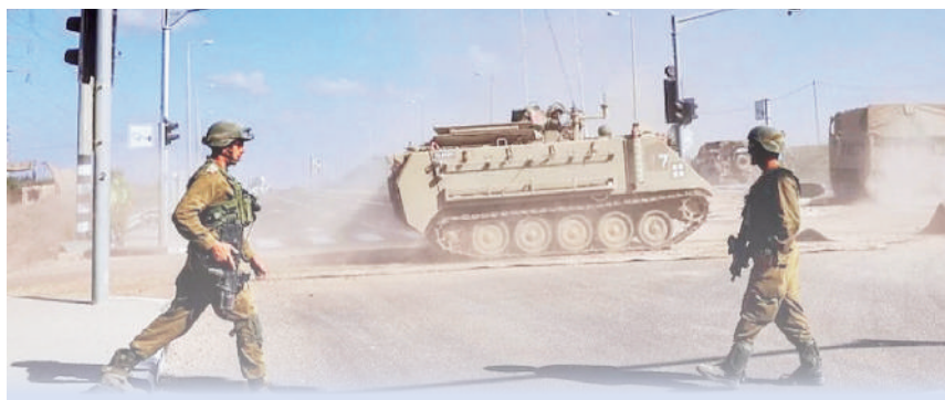
गाजा में 1000 रोगियों का इलाज करेगा इंडोनेशिया

एजेंसी | सिंगापुर दुनिया के सबसे बड़े मुस्लिम देश इंडोनेशिया के नवनिर्वाचित राष्ट्रपति प्रबोवो सुबियांटो ने शनिवार को कहा कि उनका देश आवश्यकता पड़ने पर गाजा में युद्ध विराम लागू करने के लिए शांति सेना भेजने को तैयार है।