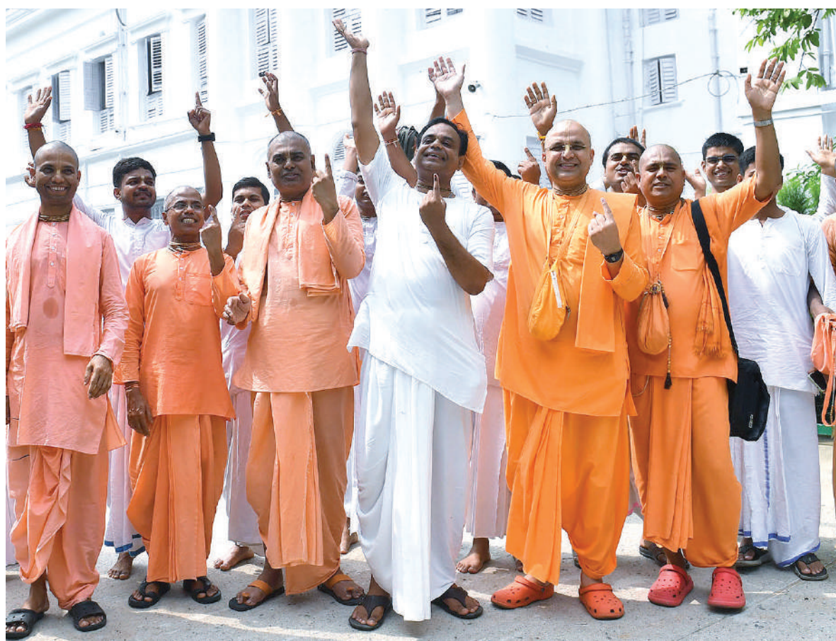
नई दिल्ली। लोकसभा चुनाव के सातवें और आखिरी चरण में शामिल 7 राज्यों और एक केंद्र शासित प्रदेश की 57 लोकसभा सीटों पर शनिवार को मतदान हुआ। इस दौरान मतदान केंद्रों पर लाइन लगी रही। चित्र में कोलाकाता के एक मतदान केंद्र पर मतदान करने के बाद प्रसन्न मुद्रा में इस्कॉन के साधु-संता हिमाचल प्रदेश के शिमला में एक केंद्र पर मौजूद महिला मतदाता।