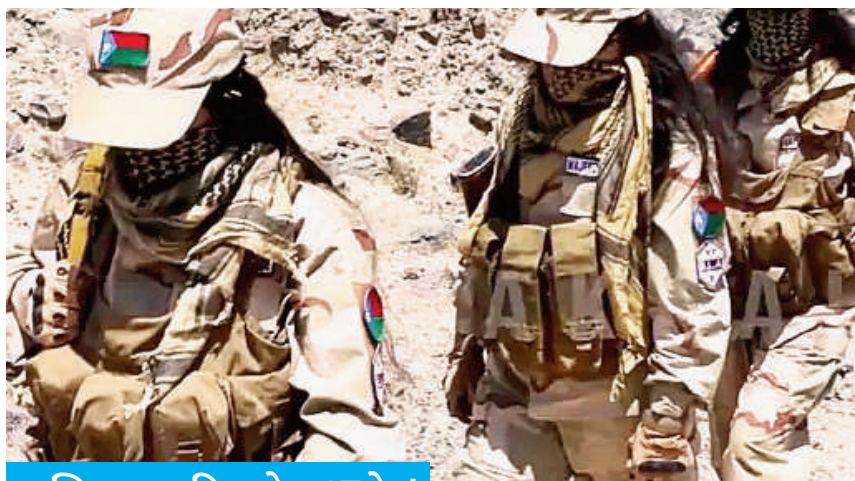
तालिबान पर फिर होगा आरोप!

एजेंसी | इस्लामाबाद पाकिस्तान के अक्षांत उत्तरपश्चिम क्षेत्र में एक 'आईईडी' विस्फोट में सेना के कम से कम चार जवान मारे गए और तीन अन्य घायल हो गए। पुलिस ने शनिवार को यह जानकारी दी। यह घटना शुक्रवार देर शाम हुई जब सुरक्षाबल देश के खैबर पख्तूनख्वा प्रांत के सरा बंगला और तारखानन इलाके में गश्त कर रहे थे। पुलिस ने बताया कि 'आईईडी' से किए गए विस्फोट में पाकिस्तानी सेना के कम से कम चार जवानों की मौत हो गयी और तीन अन्य घायल हो गए। घायलों को तुरंत अस्पताल में भर्ती कराया गया।