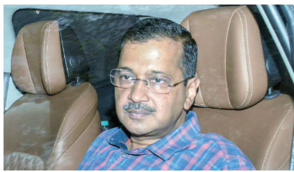
सुप्रीम कोर्ट द्वारा केजरीवाल को दी गई अंतरिम जमानत शनिवार को समाप्त हो गई। प्रवर्तन निदेशालय (ईडी) ने शनिवार को उनकी अंतरिम जमानत पर विरोध जताते हुए कहा कि ट्रायल