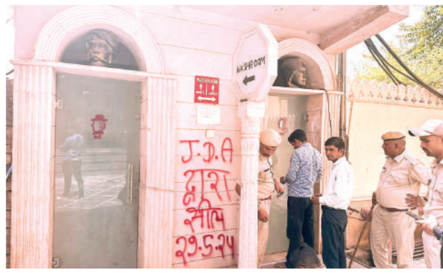
स्वीकृति के 04 मंजिला रूपलक्ष्मी साथ-साथ खसरा नं.-346 पर केपल एवं हॉटल के संचालन के स्टेज, विवाह स्थल के साथ लगती