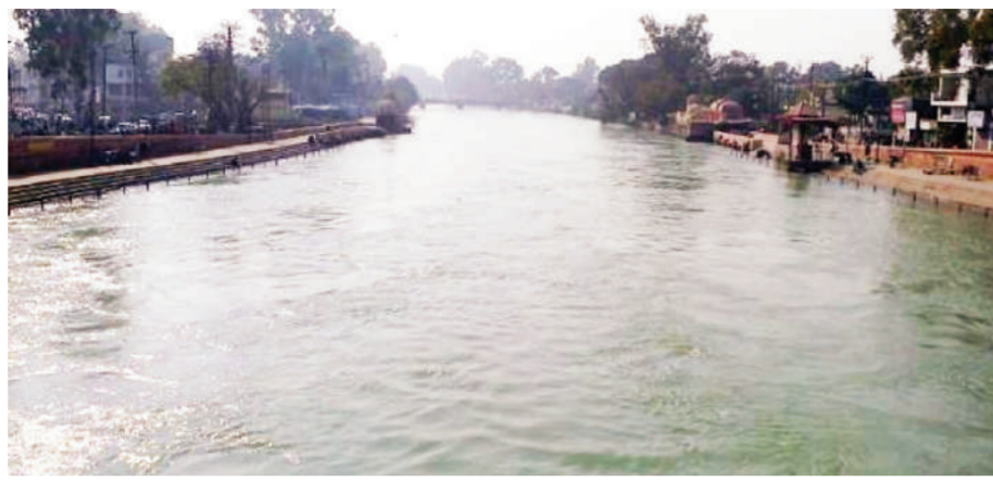
हैड के बीच पानी चोरी किया जा रहा था। किसानों की शिकायत पर जिला प्रशासन हरकत में आया है।