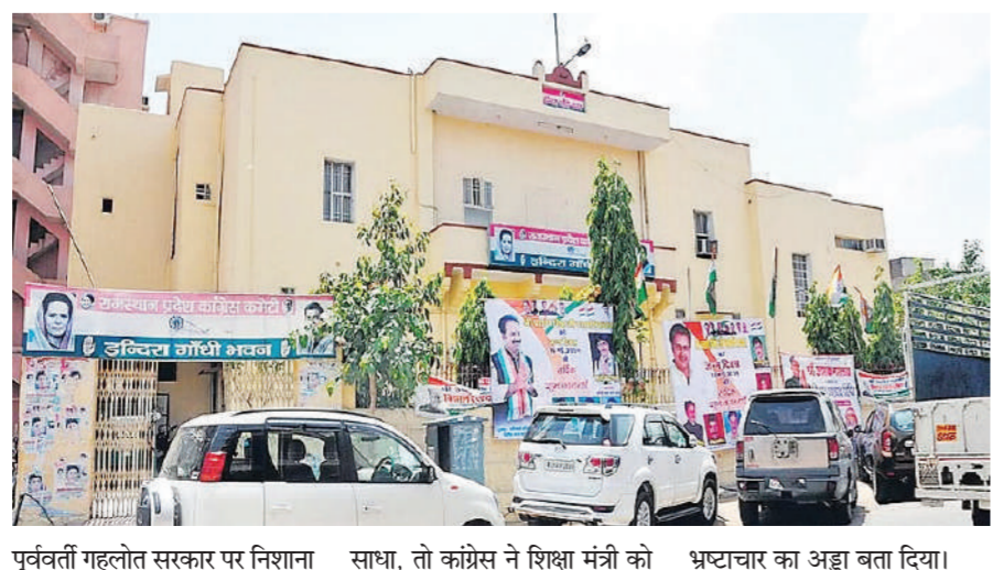
पूर्ववर्ती गहलोत सरकार पर निशाना साधा, तो कांग्रेस ने शिक्षा मंत्री को भ्रष्टाचार का अड्डा बता दिया।