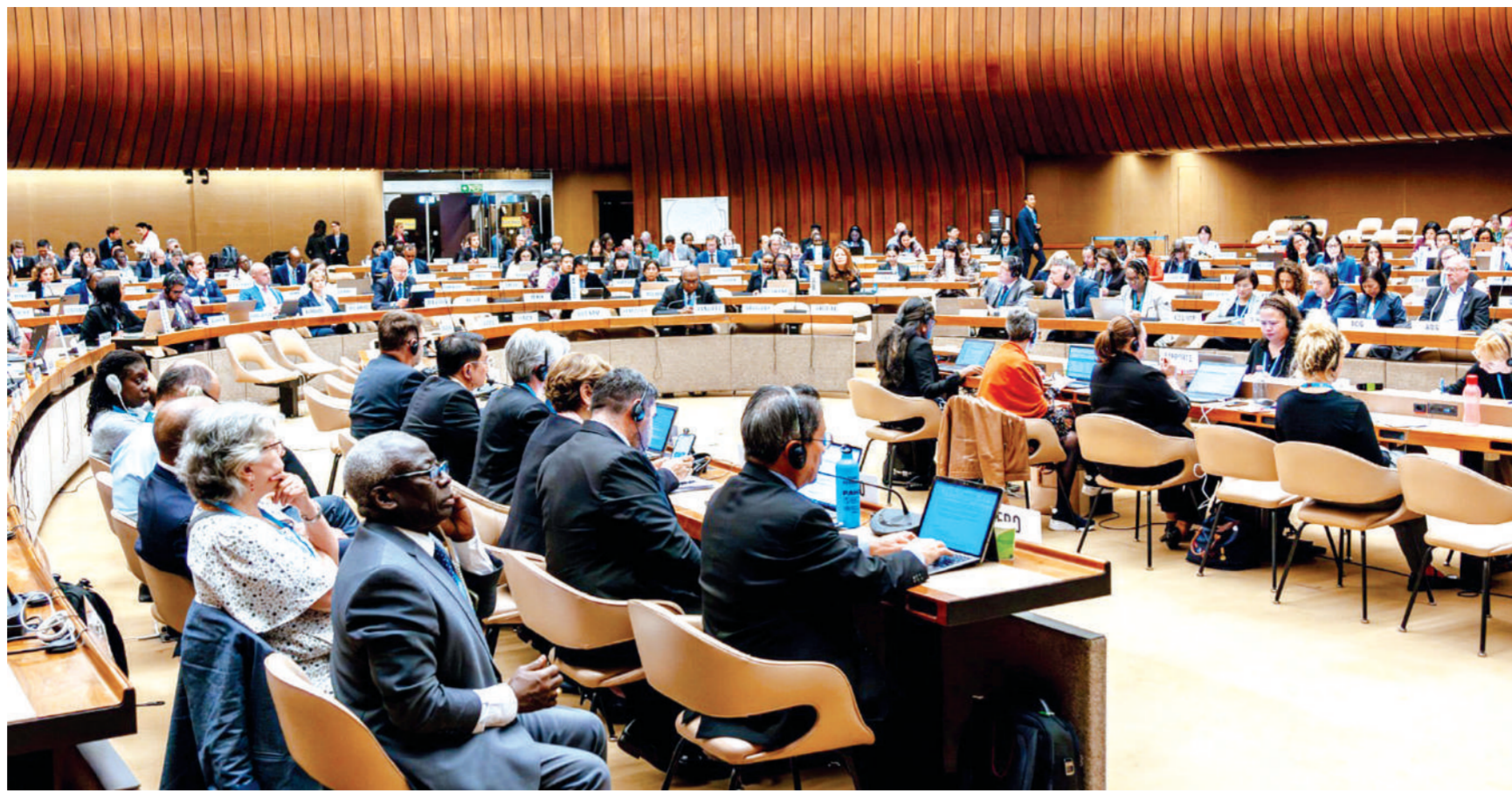
नई दिल्ली। स्वास्थ्य एवं परिवार कल्याण मंत्रालय के सचिव अपूर्व चंद्रा ने मंगलवार को जिनेवा में 77वीं विश्व स्वास्थ्य सभा (डब्ल्यू.सी.एच.) की समिति की बैठक की अध्यक्षता की। चंद्रा ने इस अवसर पर ब्रिक्स (बीआरआईसीएस) स्वास्थ्य मंत्रियों की बैठक को भी संबोधित किया।