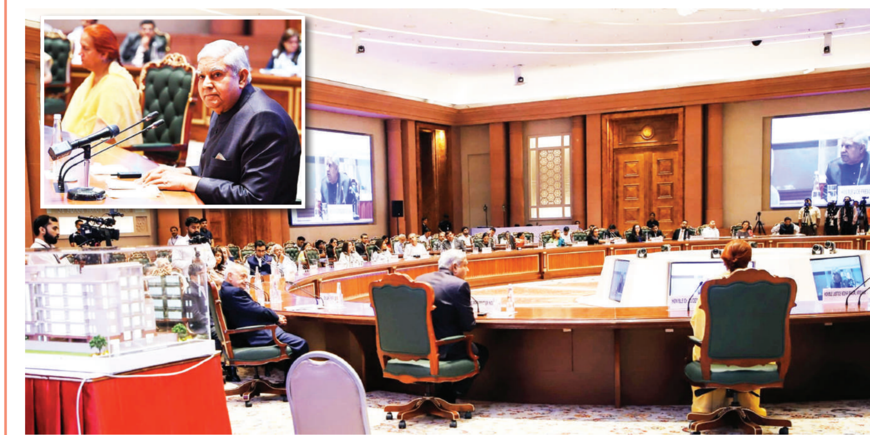
नई दिल्ली। उपराष्ट्रपति जगदीप धनखड़ ने सोमवार को सोसायटी ऑफ इंडियन लॉ फर्म्स (एसआईएलएफ) की नई इमारत का उद्घाटन किया। इस मौके पर उन्होंने कार्यक्रम को संबोधित किया। उन्होंने कहा कि हमारी कानून फर्मों को अब वैश्विक मान्यता मिल गई है।