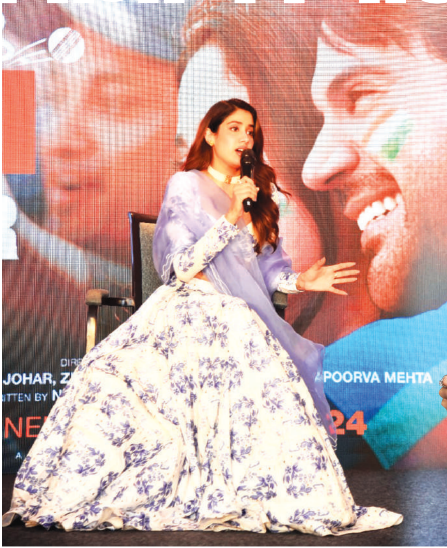
कपल को क्रिकेट देखना और खेलना पसंद

‘फिल्म में मैंने विस्फोटक बल्लेबाज सूर्य कुमार यादव के प्रसिद्ध ‘स्कूप शॉट’ को आजमाने की कोशिश की है। फिल्म की परिभाषा सिर्फ एक स्पोर्ट्स ड्रामा फिल्म तक ही सीमित नहीं है, बल्कि यह भावनाओं का मीठा समंदर है। यह कहना था बॉलीवुड एक्ट्रेस जान्हवी कपूर का, जो जयपुर में अपनी अपकमिंग मूवी मिस्टर एंड मिसेज माही के प्रमोशन के लिए आई थी। प्रमोशन के लिए जाह्वी जयपुराइट्स के बीच भी पहुंची और युवाओं के साथ फोटो क्लिक कराई। उन्होंने एयरपोर्ट से लेकर होटल और कैम्पस तक सभी का अभिवादन स्वीकार किया और लोगों को चीयर करती दिखाई दीं।