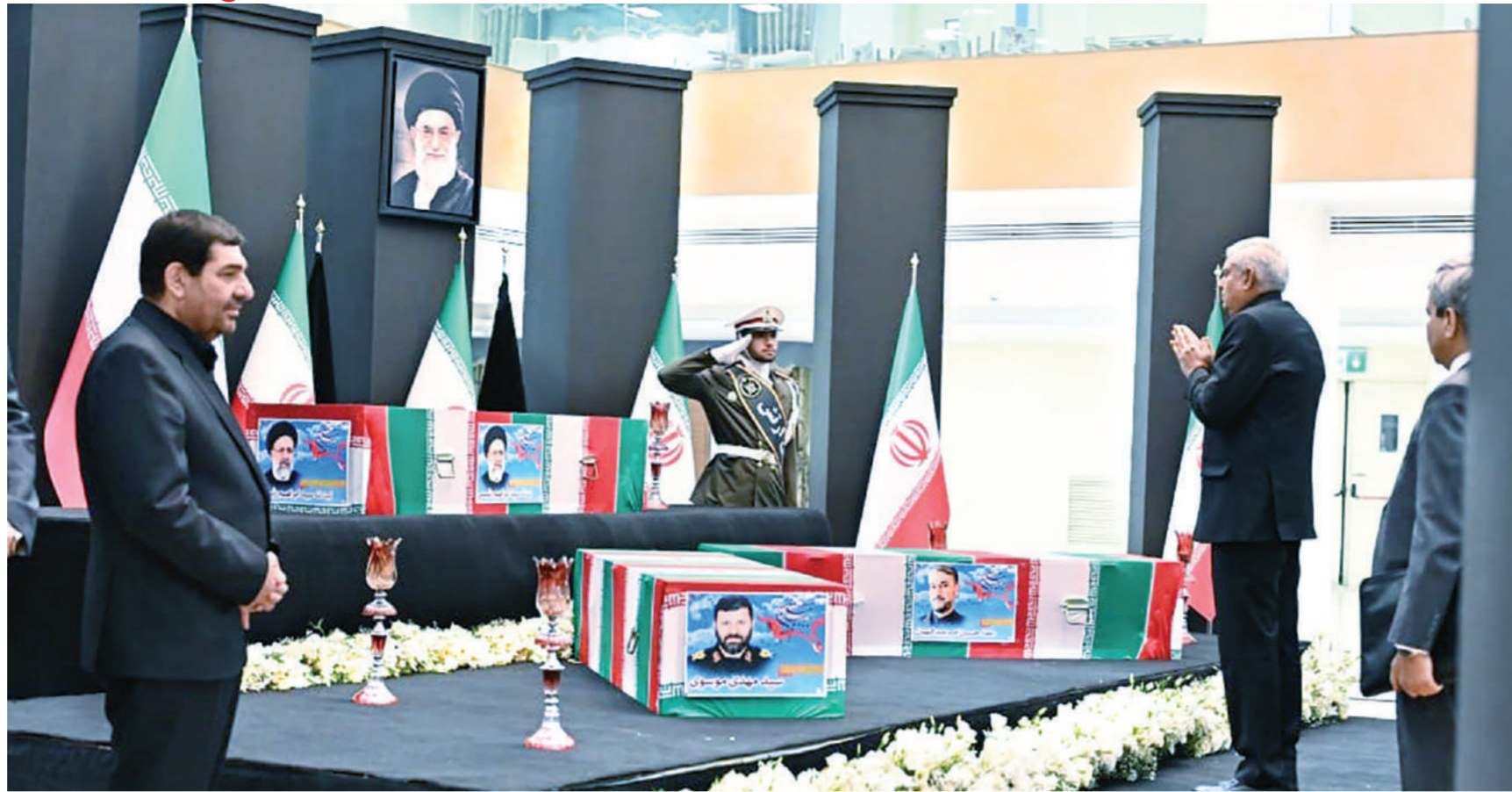
नई दिल्ली। उपराष्ट्रपति जगदीप धनखड़ हेलिकॉप्टर दुर्घटना में मारे गए ईरानी राष्ट्रपति इब्राहिम रईसी और विदेश मंत्री होसेन अमीर-अब्दुल्लाहियन की अंत्येष्टि में शामिल होने तेहरान पहुंचे। धनखड़ ने तेहरान में ईरान के कार्यवाहक राष्ट्रपति मोहम्मद मोखबर से मुलाकात की और रईसी व मीर अब्दुल्लाहियन के निधन पर शोक व्यक्त किया। उन्होंने रईसी, अमीर अब्दुल्लाहियन और अन्य ईरानी अधिकारियों को श्रद्धांजलि अर्पित की।