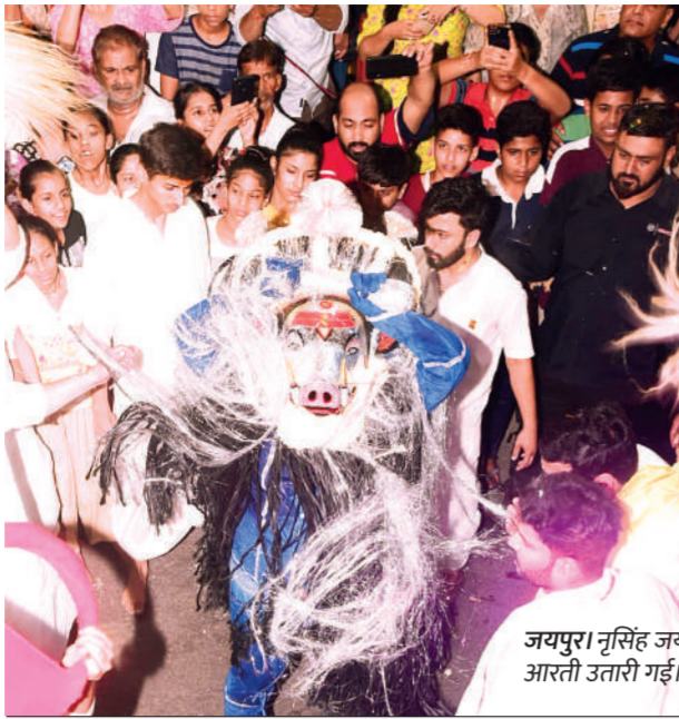
जयपुर। नृसिंह जयंती समारोह के दूसरे दिन विष्णु के अवतार भगवान वराह की लीला का आयोजन किया गया। चौड़ा रास्ता स्थित ताड़केश्वर जी मंदिर के सामने भगवान वराह प्रकट हुए। इस दौरान भगवान की आरती उतारी गई। त्रिपोलिया गेट तक भगवान वराह भ्रमण करते हुए गए और वापस ताड़केश्वर जी मंदिर पहुंचे, जहां ऊपर झरोखे में से भक्तजनों को आशीर्वाद दिया।