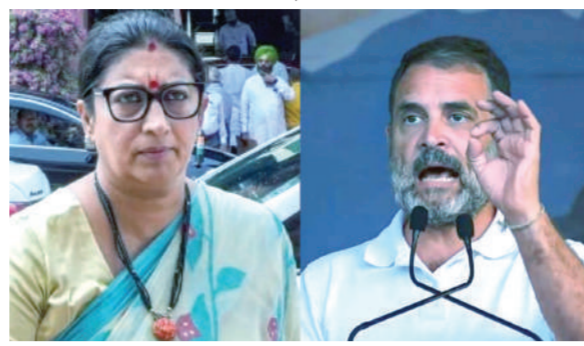
से उतरने के कारण सबसे ज्यादा कांग्रेस की प्रतिष्ठा इसी सीट पर लगी हुई है। खुद सोनिया गांधी ने यूपी में मात्र इसी सीट पर प्रचार भी किया है। दो दिन पहले ही वह यहां आई और लोगों से भावुक