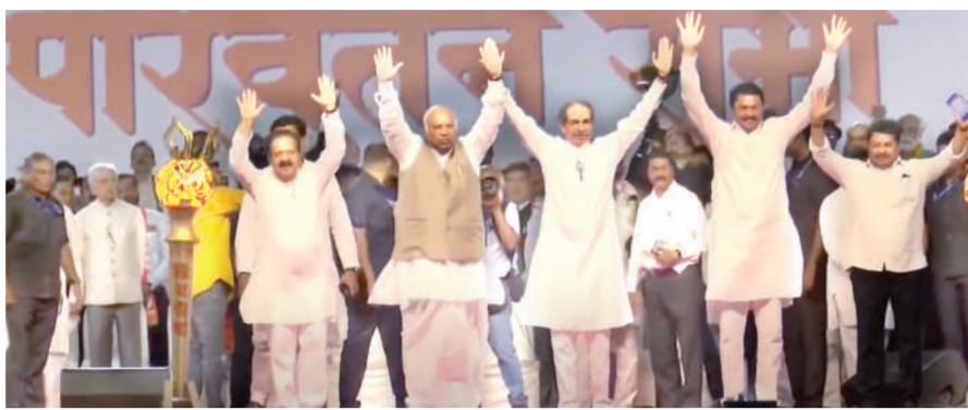
केजरीवाल ने रैली को संबोधित करते हुए भाजपा पर जोरदार हमला बोला। रैली को संबोधित करते हुए सीएम केजरीवाल ने कहा कि ये केजरीवाल को जेल में रखना और दिल्ली के लोगों

एजेंसी | मुंबई लोकसभा चुनाव के पांचवें चरण के मतदान से पूर्व शुरुवार को मुंबई में विपक्षी गठबंधन इंडिया ने रैली आयोजित कर अपनी सियासी ताकत दिखाई। इस रैली में विपक्षी दलों के कई दिग्गज जुटे। रैली में कांग्रेस के राष्ट्रीय अध्यक्ष मल्लिकार्जुन खरगे, आम आदमी पार्टी के अरविंद केजरीवाल, शिवसेना के उद्धव ठाकरे, एनसीपी नेता शरद पवार पहुंचे। आम आदमी पार्टी के राष्ट्रीय संयोजक और दिल्ली के मुख्यमंत्री अरविंद