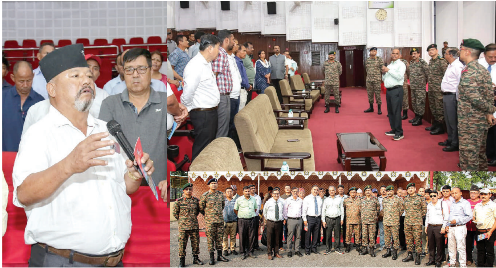
दार्जिलिंग। पश्चिम बंगाल में बेंगलुरु आर्मी कैम्प में पूर्व सैनिक कल्याण विभाग द्वारा बुधवार को 'समाधान अभियान' कार्यक्रम का आयोजन किया गया। इस दौरान पूर्व सैनिकों की विभिन्न समस्याओं का समाधान किया गया।