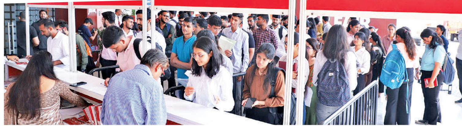
बेधड़क | जयपुर

देश-विदेश की कई जानी मानी कंपनियों ने की शिरकत