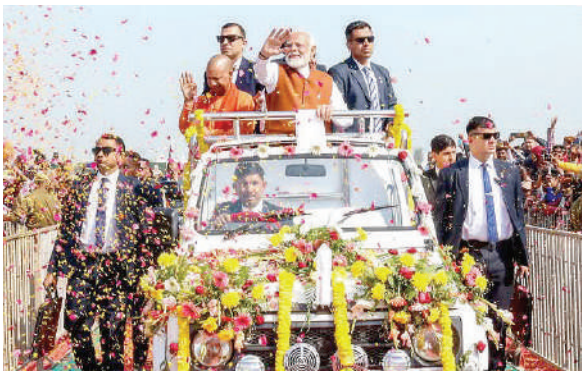
मुख्यमंत्री, 20 केंद्रीय मंत्री, उत्तर प्रदेश सरकार के मंत्री, सांसद और विधायक शामिल होंगे। साथ ही एनडीए गठबंधन के सभी दलों के नेता भी शामिल होंगे। पीएम मोदी पर्चा भरने से एक दिन पहले सोमवार को वाराणसी में मेगा रोड शो करेंगे। प्रधानमंत्री का करीब 6 किमी लंबा रोड शो बनारस हिंदू विश्वविद्यालय से शाम 4 बजे शुरू होगा और काशी विश्वनाथ मंदिर तक पहुंचकर खत्म होगा। इस दौरान वाराणसी के लोग उनका स्वागत करेंगे। पीएम मोदी का रोड शो लंका चौराहे से सोनारपुरा, गोदीलिया, बांसफाटक से गुजरते हुए काशी विश्वनाथ मंदिर तक पहुंचेगा।

प्रधानमंत्री नरेंद्र मोदी के संसदीय क्षेत्र वाराणसी में लोकसभा चुनाव के 7वें और आखिरी चरण में 1 जून को मतदान होगा। पीएम मोदी वाराणसी से लगातार तीसरी बार चुनाव लड़ने जा रहे हैं। वे 14 मई को वाराणसी लोकसभा सीट से पर्चा दाखिल करेंगे। भाजपा प्रधानमंत्री मोदी के नामांकन को बड़ा कार्यक्रम बनाने की तैयारी में जुट गई है। मोडिया रिपोर्ट के मुताबिक, पीएम मोदी के नामांकन में एकजुटता दिखाने के लिए 12