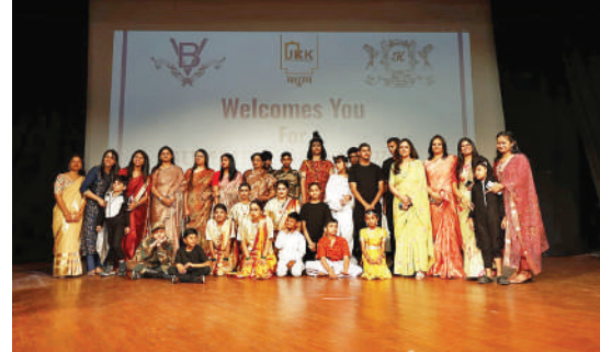
बेधड़क | जयपुर

‘समर ब्रॉडवे’ में बच्चों की प्रस्तुतियों ने मोहा मन