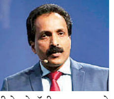
कोच्चि में एसओ सोमनाथ की फायदा ले रही हैं। सोमनाथ ने ये बातें कोच्चि में SFO टेक्नोलॉजी के कार्बन रिडक्शन इनीशिएटिव

कोच्चि। इसरो प्रमुख एस सोमनाथ ने कहा कि 10 साल में भारतीय स्पेस सेक्टर 9-10 बिलियन डॉलर (83 हजार करोड़) की इंडस्ट्री बन जाएगा। अभी हम 2 बिलियन डॉलर की इंडस्ट्री हैं। उन्होंने कहा कि प्राइवेट सेक्टर की 400 कंपनियां अपने-अपने मिशन में ISRO