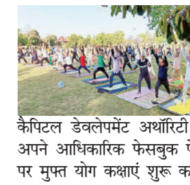
केपिटल डेवलपमेंट अथॉरिटी ने अपने आधिकारिक फेसबुक पेज पर मुफ्त योग कक्षाएं शुरू करने

इस्लामाबाद। पूरी दुनिया में लोकप्रियता हासिल करने के बाद भारत की प्राचीन शारीरिक और मानसिक एक्सरसाइज योग अब पाकिस्तान में भी आधिकारिक तौर पर शुरू हो गया है। दरअसल पाकिस्तान की राजधानी इस्लामाबाद की