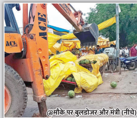
@मौके पर बुलडोजर और मंत्री (नीचे)