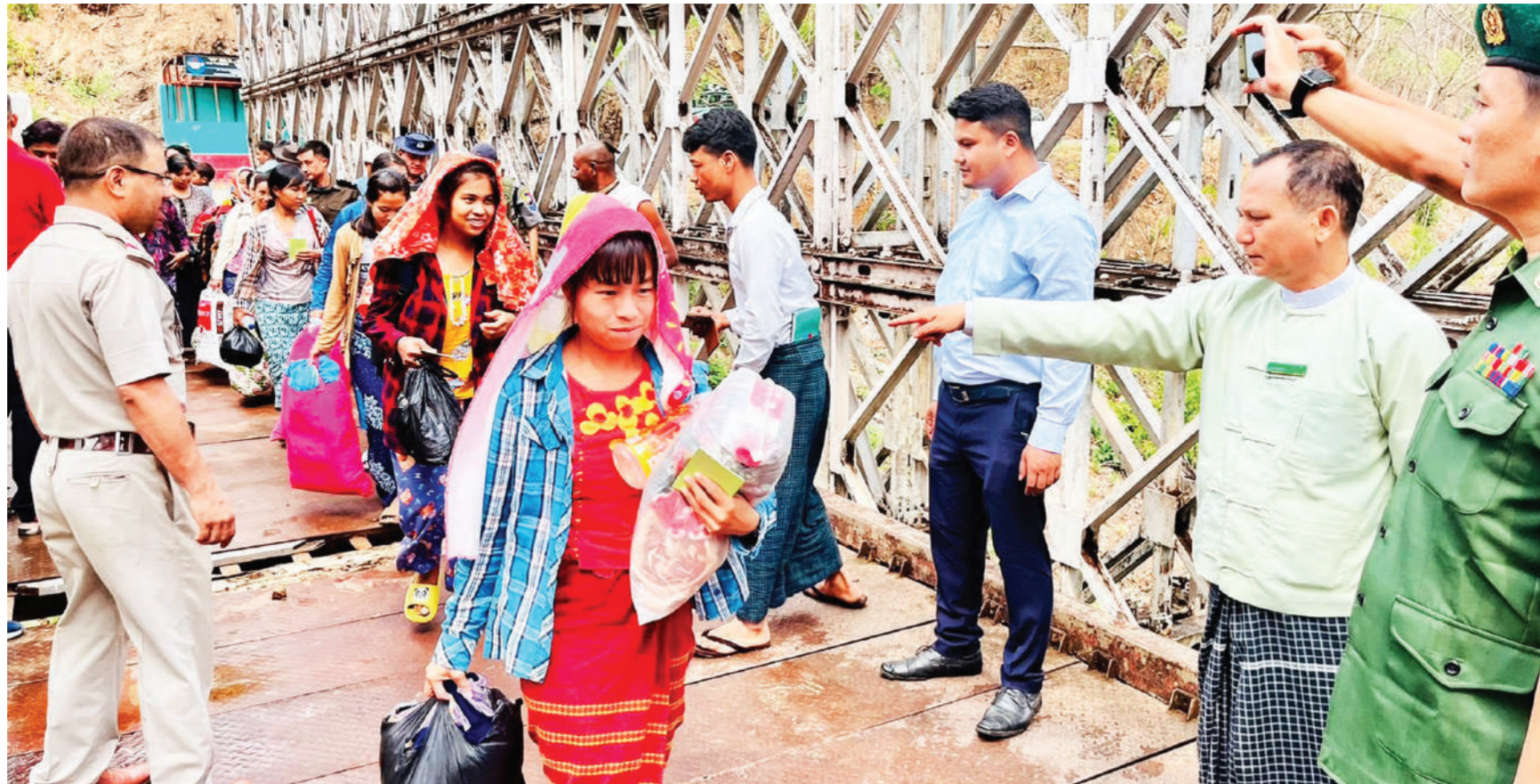
नई दिल्ली। म्यांमार के रास्ते अवैध तरीके से मणिपुर में दाखिल हुए अवैध अप्रवासियों को खिलाफ राज्य सरकार एक्शन मोड में नजर आ रही है। गुरुवार को पहले चरण में मणिपुर में रहने वाले कुल 77 अवैध अप्रवासियों को आज म्यांमार को सौंप दिया गया। राष्ट्रीय सुरक्षा के लिए खतरे में चिंताजनक वृद्धि के बाद सीएम एन बीरेन सिंह ने अवैध अप्रवासियों की पहचान करने और बायोमेट्रिक डेटा दर्ज कराने का आदेश दिया था।