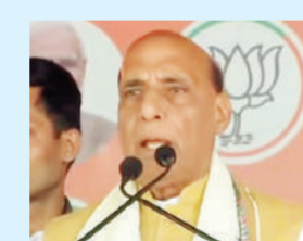
में कांग्रेस के प्रत्याशी नामांकन के बाद भाजपा को अपना समर्थन दे रहे हैं। उन्होंने कहा कि 400 पार का जो हमने लक्ष्य लिया है, वह निश्चित ही पूरा कर लेंगे। 10 साल से हम केंद्र की सरकार में हैं, हम विश्व स्तर पर काफी मजबूत हुए हैं। रक्षा मंत्री राजनाथ सिंह ने सारण लोकसभा सीट से विकास करने वाला देश है।

एजेसी | छपरा केंद्रीय रक्षा मंत्री राजनाथ सिंह ने गुरुवार को कहा कि बिहार में लालटेन युग किसी हाल में लौटकर नहीं आना चाहिए। उन्होंने राष्ट्रीय जनता दल को घेरते हुए राजीव प्रताप रूडी की तारीफ भी की। वह रूडी के समर्थन में यहां आयोजित जनसभा में बोल रहे थे। राजनाथ सिंह ने अपने संबोधन में कहा कि रूडी पेशे से पायलट भी हैं, इसलिए वह हवाई जहाज उड़ते हैं। जैसे ही सारण के सभी लोकसभा प्रत्याशी को हवा में उड़ा देंगे। भाजपा की विचारधारा को देखते हुए एमपी और गुजरात