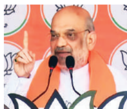
शाह ने दावा किया, दो चरण के चुनाव में कांग्रेस दूरबीन से भी नजर में नहीं आ रही है और नरेंद्र मोदी संजुची मारकर 400 की दौड़ में बहुत आगे निकल गए हैं। केन्द्रीय गृह मंत्री ने कहा, यह चुनाव नरेंद्र मोदी को तीसरी बार प्रधानमंत्री बनाने का चुनाव है। यह चुनाव हमारे देश के अर्थ तंत्र को संसार का तीसरे नंबर का अर्थ तंत्र बनाने का चुनाव है। यह चुनाव तीन करोड़ लखपति दीदी बनाने का चुनाव है। यह चुनाव आतंकवाद और नक्सलवाद को समाप्त करने का चुनाव है।