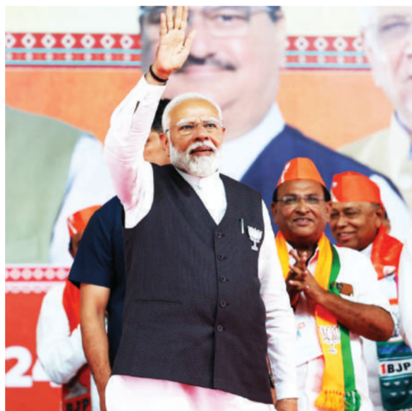
होता है, फिर पार्लियामेंट शुरू होती है। पीएम ने कहा कि उन्होंने (महाराजा दिग्विजय सिंह ने) जो बीज बोए, उसके कारण आज भी पोलैंड के साथ हमारा रिश्ता मजबूत है। जाम साहब के परिवार के साथ मेरा नाता रहा है, उनका आशीर्वाद रहा है। आज मैं यहां आते समय,

एजेसी | जामनगर प्रधानमंत्री नरेंद्र मोदी ने गुरुवार को गुजरात के जामनगर में एक जनसभा को संबोधित करते हुए कहा कि कुप्रचार से शुरू हुई कांग्रेस की राजनीति, आज कुंठा से घिर चुकी है। इनकी जो कुंठा पहले गुजरात को लेकर थी, आज कांग्रेस के भीतर देश की प्रगति को लेकर भी वहीं कुंठा, वहीं नफरत नस नस में भरी पड़ी है। पीएम मोदी ने कहा कि गुजरात ने वर्तमान में देश के लिए जितना योगदान दिया है, उतना ही योगदान अतीत में भी दिया है। जामनगर के महाराजा दिग्विजय सिंह ने द्वितीय विश्व युद्ध के समय पोलैंड के नागरिकों को यहां शरण दी थी। आज भी जब पोलैंड की पार्लियामेंट शुरू होती है, तो सबसे पहले जामनगर का और महाराजा दिग्विजय सिंह जी का स्मरण