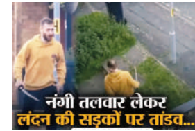
नगी तलवार लेकर लंदन की सड़कों पर तांडव...

पूर्वी लंदन के हेनॉल्ट ट्यूब स्टेशन के पास एक शख्स ने तलवार से कई लोगों पर हमला किया। डराने वाली इस घटना में नगी तलवार लेकर सड़क पर निकले शख्स ने दो पुलिसकर्मीयों सहित पांच लोगों पर हमला कर उनको घायल किया। इस हमले में घायल एक 13 साल