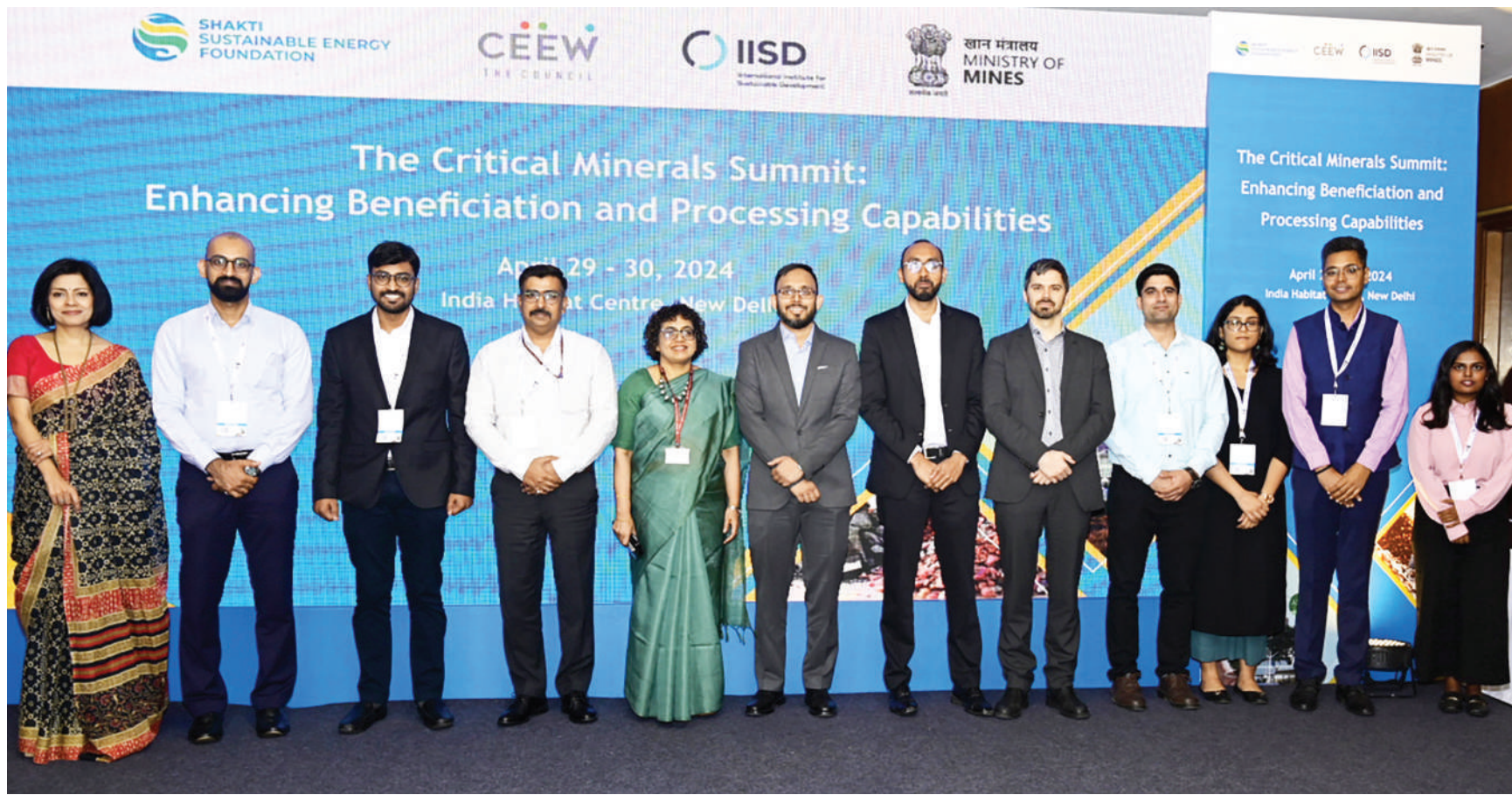
नई दिल्ली। खनन मंत्रालय की ओर से नई दिल्ली में महत्वपूर्ण खनिजों पर आयोजित दो दिवसीय शिखर सम्मेलन मंगलवार को इंडिया हेबिटेड सेंटर में शुरू हुआ। सम्मेलन में विभिन्न मसलों पर विचार विमर्श हो रहा है।