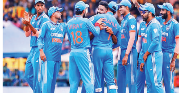
टीम में कौन-कौन: रोहित शर्मा (कप्तान), हार्दिक पंड्या (उपकप्तान), यशवी जायसवाल, विराट कोहली, सुर्यकुमार यादव, ऋषभ पंत (विकेट कीपर), संजू सैमसन (विकेट कीपर), शिवम दुबे, रवींद्र जडेजा, अक्षर पटेल, कुलदीप यादव, युजवेंद्र चहल, अर्शदीप सिंह, जसप्रीत बुमराह, मोहम्मद सिराज। रिजर्व- शुभमन गिल, रिंकु सिंह, खलील अहमद और आवेश खान।

वदले हुए टी20 बल्लेबाज के रूप में सामने आए हैं। मध्यक्रम में उनकी मौजूदगी टीम इंडिया के काफी काम आ सकती है। मौजूदा आईपीएल में मुंबई इंडियंस की कप्तानी संभालने वाले हार्दिक पंड्या को टी20 विश्व कप के लिए उप-कप्तान बनाए रखा गया है। हालांकि, गुजरात टाइटन्स के कप्तान के रूप में आईपीएल 2024 में फीका प्रदर्शन करने वाले शुभमन गिल को रिजर्व में रखा गया है। वहीं, रिंकु सिंह भी स्टैंडबाय खिलाड़ी के रूप में चुने गए हैं।