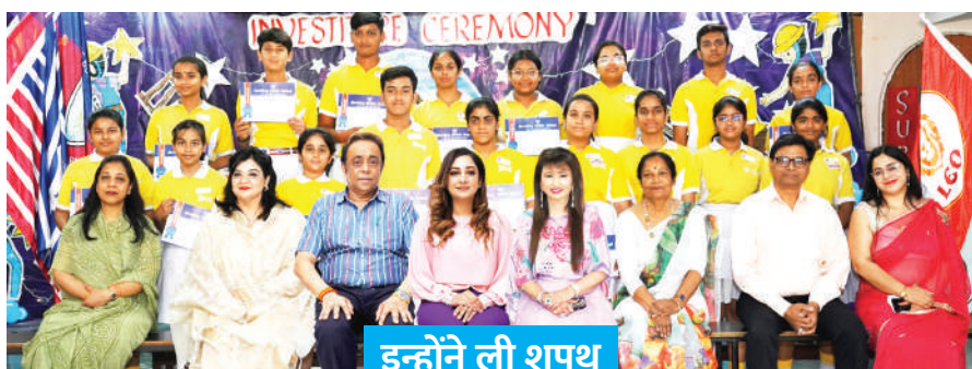
इन्होंने ली शपथ