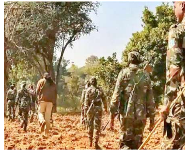
गांवों के बीच जंगल में हुई। (डॉआरजी) और स्पेशल टास्क फोर्स (एसटीएफ) की संयुक्त

एजेंसी। बीजापुर। छत्तीसगढ़ में नारायणपुर और कांकेर जिलों की सीमा पर जंगल में मंगलवार को नक्सलियों के साथ सुरक्षाकर्मियों की मुठभेड़ हो गई। इस मुठभेड़ में तीन महिलाओं सहित 10 नक्सली मारे गए। उपमुख्यमंत्री विजय शर्मा ने बताया कि 15 दिनों में सुरक्षा बलों का नक्सलियों पर यह दूसरा बड़ा हमला है। उन्होंने एक वीडियो बयान में इसे राज्य में नक्सल विरोधी अभियान में एक बड़ी सफलता बताया। पुलिस के मुताबिक, ताजा मुठभेड़ मंगलवार सुबह करीब 6 बजे नक्सलियों के गढ़ माने जाने वाले अबुलमाड इलाके के टेकमेटा और काकुर