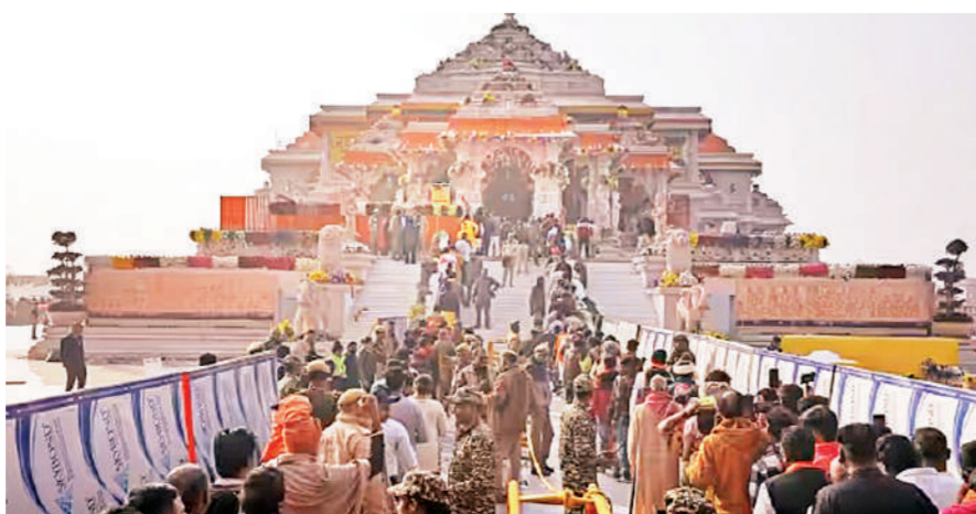
लोग रामलाल के दर्शन के लिए आते हैं। साथ ही, उन्होंने कहा कि लोगों की संख्या दिन-ब-दिन बढ़ती ही जा रही है। रामनवमी मेले के बाद आरती और सुगम दर्शन फिर से शुरू हो गए हैं। पास