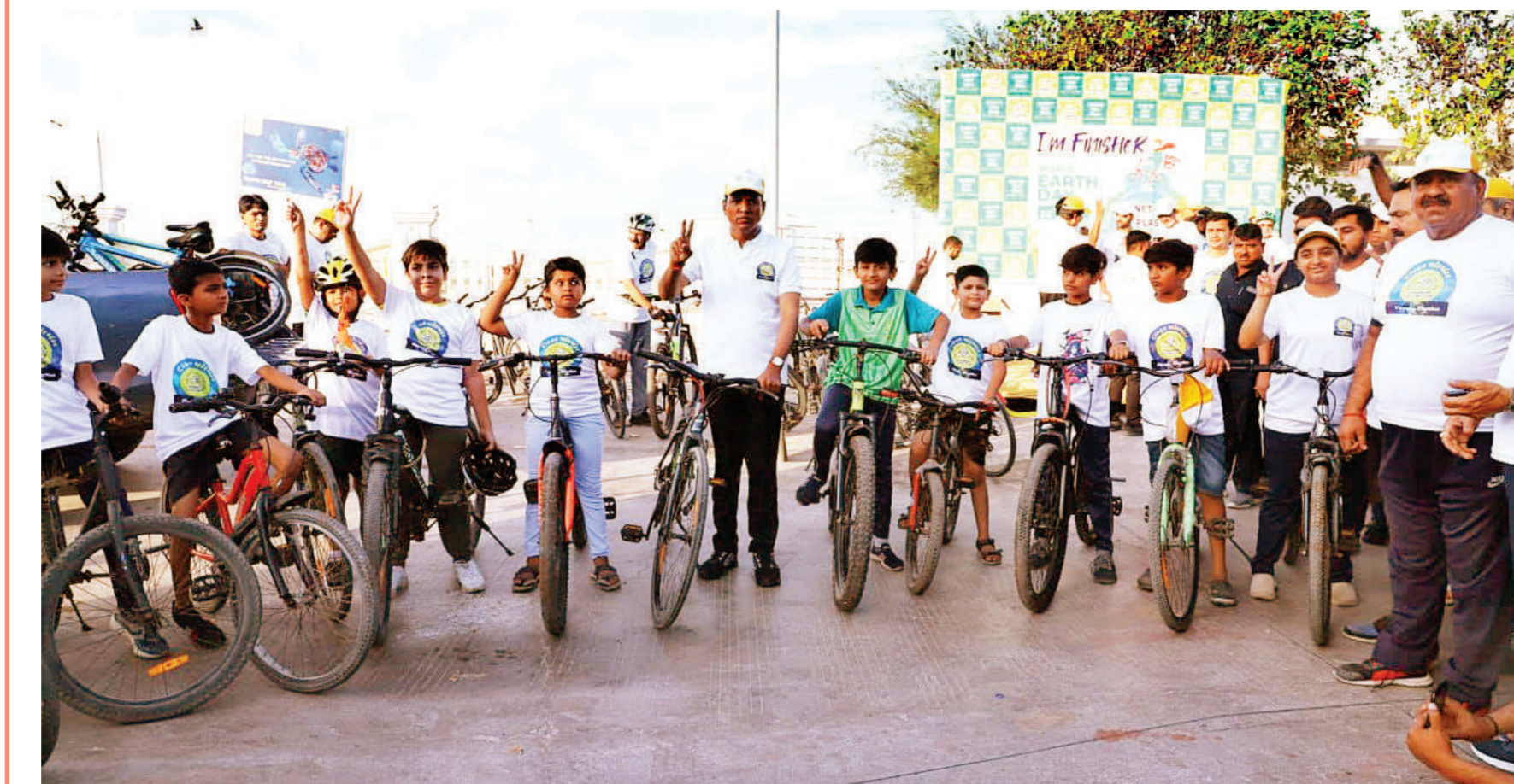
अहमदाबाद। केंद्रीय स्वास्थ्य मंत्री मनसुख मंडाविया ने विश्व पृथ्वी दिवस पर आज गुजरात के पोरबंदर में आयोजित साइकिल रैली में भाग लिया। मंडाविया ने इस मौके पर पर्यावरण संरक्षण का संदेश भी दिया।