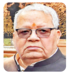
कलराज मिश्र राज्यपाल, राजस्थान