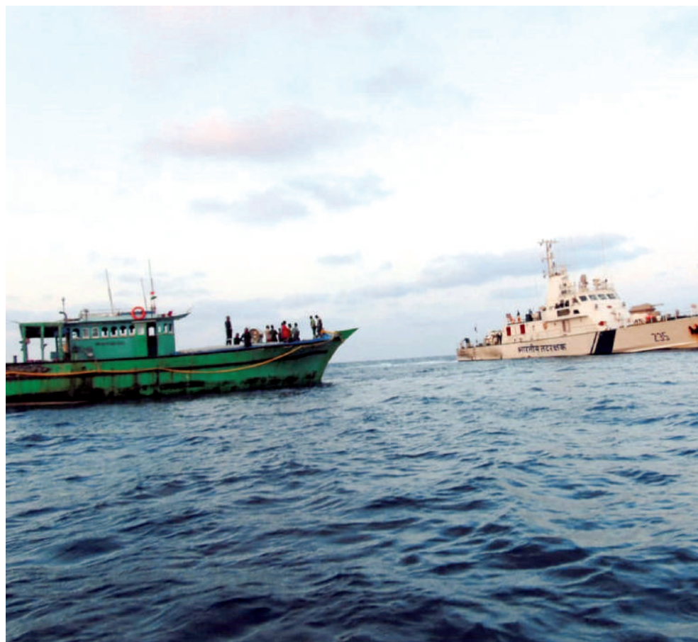
करवार। भारतीय तटरक्षक बल ने कर्नाटक के करवार तट के निकट समुद्र में फंसी मछली पकड़ने की एक नौका को सुरक्षित बाहर निकाल तट पर लाई। इस छोटे जहाज रोजरी का इंजन कर्नाटक के कारवार से लगभग 215 समुद्री मील की दूरी पर खराब हो गया था।