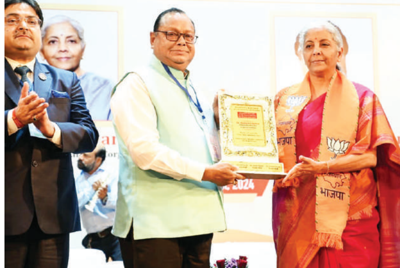
ओपीएस को कांग्रेस ने बनाया था मुद्दा

कांग्रेस ने अपने घोषणा पत्र में ओपीएस का जिक्र तक नहीं किया जबकि ओपीएस कांग्रेस का मुद्दा था। वहीं राजस्थान की पूर्ववर्ती गहलोत सरकार ने ओपीएस के नाम पर भ्रम फैलाने का काम किया। कांग्रेस घोषणा पत्र जारी करने के समय दिल्ली के नेताओं ने ओपीएस पर अशोक गहलोत की राय क्यों नहीं ली। वित्त मंत्री निर्मला सीतारमण ने कहा कि प्रधानमंत्री नरेंद्र मोदी के नेतृत्व में भाजपा का संकल्प पत्र पूरी तरह से गुड गवर्नेंस, डिजिटल गवर्नेंस के साथ इंफ्रास्ट्रक्चर डवलप करने के उद्देश्य से तैयार किया गया है।