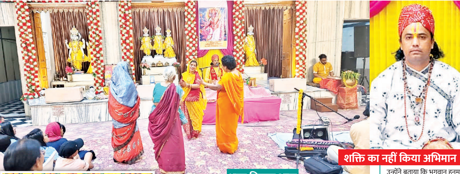
शक्ति का नहीं किया अभिमान

हनुमान माता सीता की खोज में लंका तक गए और मार्ग में कहीं विश्राम नहीं किया। बुद्धि का सदुपयोग करके सुरसा के मुख में सूक्ष्म शरीर बनाकर प्रवेश कर गए और लंका में अपनी पूंछ को बड़ाकर पूरी लंका को भस्म कर दिया। प्रभु राम के आदेश का उन्होंने पालन किया और अपनी सफलता का श्रेय हमेशा भगवान को दिया।