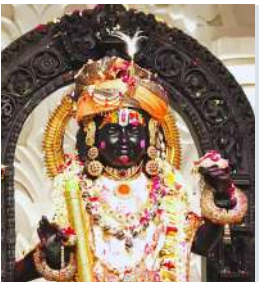
ललाट पर सूर्य किरण 12.16 बजे के करीब 5 मिनट तक पड़ेगी।

एजेंसी। अयोध्या। अयोध्या में रामनवमी को लेकर तैयारियां जोर-शोर से चल रही हैं। इस दिन यानी 17 अप्रैल को सूर्य की किरणों करीब पांच मिनट तक रामलला के मस्तक पर अभिषेक करेंगी। रामनवमी के दिन राम लाल भक्तों को 19 घंटे दर्शन देंगे। राम मंदिर निर्माण समिति के अध्यक्ष नृपेंद्र मिश्र ने बताया कि रामनवमी पर भगवान रामलला के