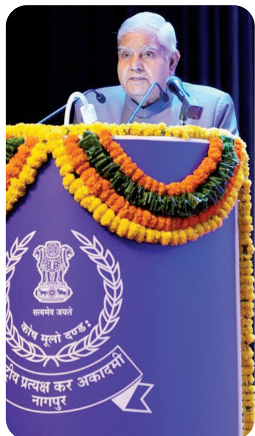
नागपुर। उपराष्ट्रपति जगदीप धनखड़ सोमवार को महाराष्ट्र के नागपुर में राष्ट्रीय प्रत्यक्ष कर अकादमी में भारतीय राजस्व सेवा (आईआरएस) के 76वें बैच के दीक्षांत समारोह में शामिल हुए। उन्होंने समारोह में राजस्व सेवा अधिकारियों को संबोधित भी किया।