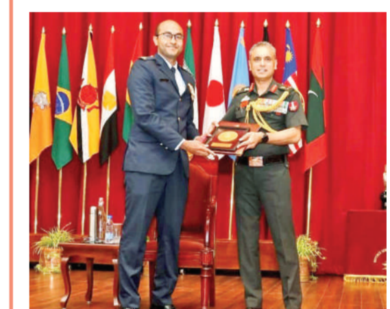
वेलिंगटन। तमिलनाडु के वेलिंगटन स्थित डिफेंस स्टाफ कॉलेज (डीएससी) में शनिवार को 79वें स्टाफ कोर्स के लिए दीक्षांत समारोह का आयोजन किया गया।