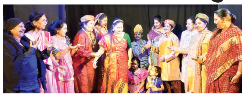
णामोकार मंत्र से पति को जिंदा किया

सोमा अपनी ससुराल पहुंचती है, क्योंकि सोमा ने माताजी से नित्य देव दर्शन और रात्रि भोजन का त्याग का नियम ले रखा था। उसके ससुराल में सास और ससुर और पति सोम द्वारा जैन धर्म महत्वपूर्ण विश्वास रखने वाली सोमा के देव दर्शन और रात्रि भोजन त्याग का विरोध करते हैं। उस पर जुल्म करते हैं। पति द्वारा नाग से कटवाकर मारने की योजना बनाई जाती है, लेकिन सोमा की सच्ची भक्ति से जब सोमा नाग को पहनती है तो वह फूलों की माला बन जाती है। जब वह अपने पति को उस माला को पहनाती है तो वह सांप बन जाता है और पति को डस लेता है।