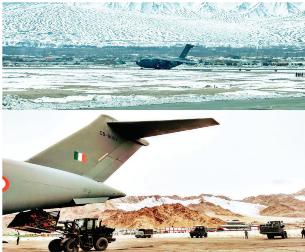
सियाचिन। सेना ने शनिवार को 40वें सियाचिन दिवस के अवसर पर ऑपरेशन मेघदूत के जरिए अपने अदम्य शौर्य और साहस का परिचय दिया। सियाचिन, काराकोरम पर्वत श्रृंखला में करीब 20,000 फीट की ऊंचाई पर स्थित दुनिया का सबसे ऊंचा युद्धक्षेत्र है जहां सालभर यहाँ बर्फ जमी रहती है और सर्दियों में तापमान माइनस 50 डिग्री तक गिर जाता है। ठीक 40 साल पहले आज ही के दिन यानी 13 अप्रैल 1984 को सेना ने ऑपरेशन मेघदूत चलाकर इस क्षेत्र में पाक सेना को शिकस्त दी थी।