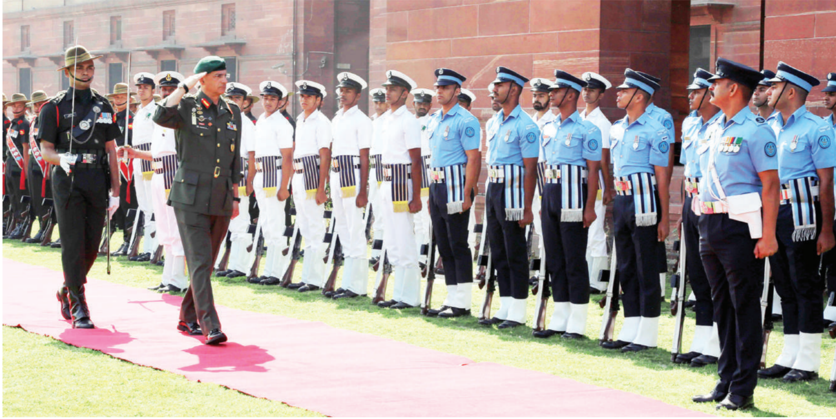
नई दिल्ली। ग्रीस के सेना प्रमुख जनरल दिमित्रियोस चैपिस भारत की यात्रा पर हैं। रविवार को उन्होंने नई दिल्ली में साउथ ब्लॉक लॉन में स्ट्राइकर-सर्विस गार्ड ऑफ ऑनर का निरीक्षण किया। उन्होंने भारत के सीडीएस जनरल अनिल चौहान से मुलाकात की। ग्रीस के सैन्य प्रमुख की इस यात्रा को बहुत ही अहम माना जा रहा है। इससे दोनों देशों के बीच सैन्य सहयोग बढ़ने की उम्मीद है।