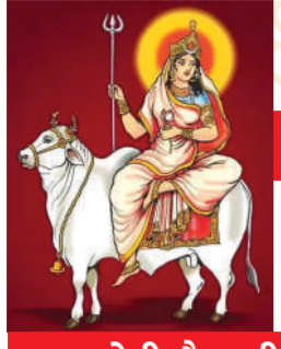
प्रथम देवी शैलपुत्री

चैत्र नवरात्रि बुधवार से आरम्भ हो रही है। मान्यता के अनुसार मां दुर्गा पहले स्वरूप में 'शैलपुत्री' के नाम से जानी जाती हैं। आदि शक्ति ने अपने इस रूप में शैलपुत्र हिमालय के घर जन्म लिया था। इसी कारण इनका नाम शैलपुत्री पड़ा। शैलपुत्री नंदी नाम के वृषभ पर सवार होती हैं और इनके दाहिने हाथ में त्रिशूल और बाएं हाथ में कमल का पुष्प है। देवी शैलपुत्री का प्रिय पुष्प : गुड़हल। देवी शैलपुत्री नैवेद्य : शुद्ध घी।