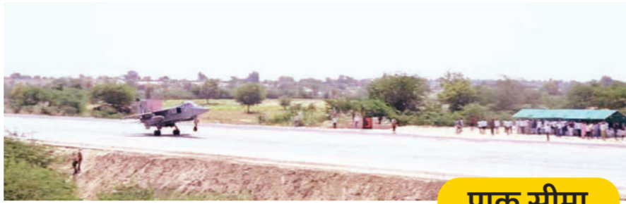
ट्रांसपोर्ट एयरक्राफ्ट और एंटीनोव एन-32 ट्रांसपोर्ट एयरक्राफ्ट उतरा। यह विमान 55 डिग्री सेल्सियस तापमान में भी उतर सकता है। पश्चिमी सीमा पर गर्मी के मौसम में तापमान 50 डिग्री सेल्सियस

बेधडक | जयपुर भारत-पाकिस्तान सीमा से करीब 40 किलोमीटर दूर राष्ट्रीय राजमार्ग संख्या-925ए पर सोमवार को भारतीय वायुसेना के लड़ाकू विमान उतरे। सांचौर-बाड़मेर जिले से सटे अगड़वा से गुजर रहे इस राष्ट्रीय राजमार्ग पर बनी आपातकालीन लैंडिंग फील्ड पर सबसे पहले लड़ाकू विमान तेजस को टच एंड गो किया गया। इसके बाद तेजस उतरा। इसके बाद लड़ाकू विमान जगुआर और फिर सुखोई-30 सहित अन्य विमान उतारे गए। दोपहर में सी-295