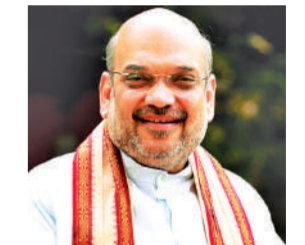
सबसे पहले उन्होंने लोकसभा चुनाव प्रचार और जनसंपर्क अभियान की समीक्षा की। संक्षिप्त समीक्षा में सभा से पूछा गया कि अभी तक पत्रा प्रमुख सहित कितने प्रतिशत कार्य किया गया है।

भारतीय जनता पार्टी ने पीएम नरेंद्र मोदी के हाल के उत्तर प्रदेश के दौरे के पश्चात चुनाव अभियान तेज कर दिया है। पार्टी के वरिष्ठ नेता पश्चिम उत्तर प्रदेश को खासतौर से मथ रहे हैं। बुधवार को केंद्रीय गृह मंत्री अमित शाह ने मुजफ्फरनगर में पार्टी की सभा को संबोधित किया जबकि रक्षा मंत्री राजनाथ सिंह ने गाजियाबाद में चुनाव सभा को संबोधित किया। अमित शाह ने चुनाव सभा के संबोधन के साथ ही भाजपा की लोकसभा कोर कमेटी की बैठक में भी भाग लिया और पार्टी नेताओं व कार्यकर्ताओं को बूथ प्रबंधन के मंत्र दिए। उन्होंने जीत के लिए हर घर के दरवाजे पर दस्तक देने का आह्वान किया।