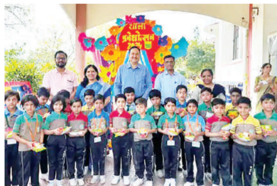
बेधड़क | जयपुर

न्यू सेशन के आगाज के साथ शुरू हुई स्टूडेंट्स की लर्निंग