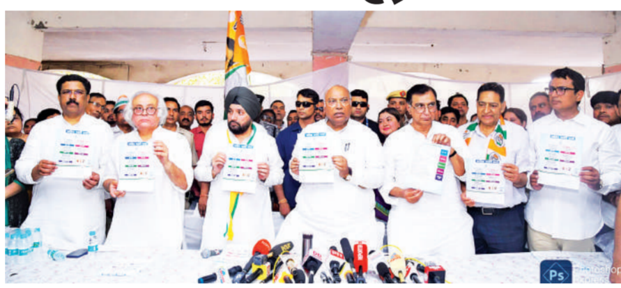
शुरुआत की। इस मौके पर उन्होंने कांग्रेस के पांच 'न्याय' और 25 'गारंटी' का उल्लेख किया। इस अवसर पर खरगे ने कहा कि इन गारंटी के कार्ड हमारे लोग घर-घर बाँटेंगे। वह लोगों को बताएंगे कि हमारी सरकार आने के बाद हम क्या क्या काम करेंगे। उन्होंने कहा, हम लोगों को गारंटी देते हैं कि हमारी सरकार हमेशा गरीबों के साथ रहेगी और गरीबों के लिए काम करेगी। कांग्रेस अध्यक्ष ने संयुक्त प्रगतिशील गठबंधन सरकार के समय की प्रमुख योजनाओं और कानूनों का उल्लेख करते हुए कहा कि कांग्रेस की सरकारों में देश की जनता को फायदा हुआ है

कांग्रेस ने बुधवार को 'घर-घर गारंटी' अभियान का शुभारंभ किया। जिसका मकसद देशभर में आठ करोड़ परिवारों तक पहुंचना है। इस दौरान पार्टी के अध्यक्ष मल्लिकार्जुन खरगे ने आरोप लगाया कि प्रधानमंत्री नरेंद्र मोदी 'मोदी की गारंटी' की बात करते हैं, लेकिन यह (गारंटी) विफल है और लोगों तक नहीं पहुंचती है। लेकिन उनकी पार्टी जो गारंटी दे रही है, उन पर वह अमल करेगी। पार्टी का यह चुनावी अभियान पांच 'न्याय' और 25 'गारंटी' पर आधारित है। खरगे ने उत्तर पूर्वी दिल्ली लोकसभा क्षेत्र में इस अभियान की