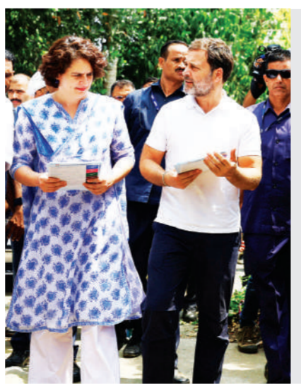
राहुल के पास न कार, ना कोई दुपहिया वाहन

कहा कि वह वायनाड के मुद्दों को देश और दुनिया के सामने लाने के लिए हमेशा तैयार हैं। उन्होंने कहा कि अगर दिल्ली और केरल में कांग्रेस की सरकार बनी तो राज्य की सारी समस्याओं का समाधान निकाल लेंगे। ज्ञात रहे कि 2019 के चुनाव में राहुल गांधी वायनाड से 4,31,770 वोटों के अंतर से जीते थे। राहुल गांधी ने नामांकन पत्र में अपनी संपत्ति के साथ उनके खिलाफ चल रहे मामलों की भी जानकारी दी है। शपथ पत्र में उनके खिलाफ कुल 18 आपराधिक मामलों का जिक्र किया है। उन्होंने सूरत कोर्ट की तरफ से सुनवाई गई सजा का भी जिक्र किया है।