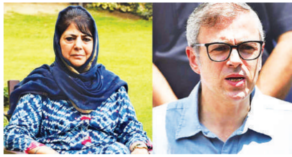
पीडीपी का यह फैसला नेशनल कॉन्फ्रेंस ने हाल की इस घोषणा के बाद आया है कि वह कश्मीर घाटी की तीनों सीट पर अपने उम्मीदवार उतारेगी। नेशनल कॉन्फ्रेंस ने इंडिया गठबंधन में हुए सीट बंटवारे के तहत जम्मू की दो सीट कांग्रेस के लिए छोड़ दीं।

अकेले चुनाव लड़ेगी। मुफ्ती ने कहा कि नेशनल कॉन्फ्रेंस ने हमारे लिए उम्मीदवार खड़ा करने और चुनाव लड़ने के अलावा कोई विकल्प नहीं छोड़ा है। महबूबा की इस घोषणा से साफ है कि अब पीडीपी और नेशनल कॉन्फ्रेंस लोकसभा चुनाव में आमने-सामने होंगी। हालाँकि, जम्मू की दो संसदीय सीटों पर चुनाव लड़ने का फैसला अभी किया जाना है। महबूबा मुफ्ती ने कहा कि पार्टी का संसदीय बोर्ड उम्मीदवारों पर कुछ दिनों में अंतिम फैसला करेगा।