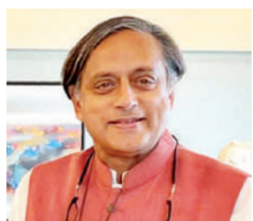
कहा, पीएम नरेंद्र मोदी का विकल्प अनुभवी, सक्षम और विविध भारतीय नेताओं का वह समूह है, जो लोगों की परेशानियों के प्रति जवाबदेह होगा और व्यक्तिगत अहंकार से प्रेरित नहीं होगा।

कांग्रेस नेता शशि थरूर का कहना है कि प्रधानमंत्री नरेंद्र मोदी का विकल्प कौन हो सकता है, यह सवाल संसदीय प्रणाली में अप्रासंगिक है, क्योंकि हम किसी व्यक्ति को नहीं, बल्कि एक पार्टी या पार्टियों के गठबंधन को चुनते हैं। थरूर ने सोशल मीडिया मंच एक्स पर कहा कि एक पत्रकार ने उनसे यह सवाल पूछा था। उन्होंने लिखा, मुझे एक ऐसे शब्द की पहचान करने के लिए कहा है जो नरेंद्र मोदी का विकल्प है। थरूर ने