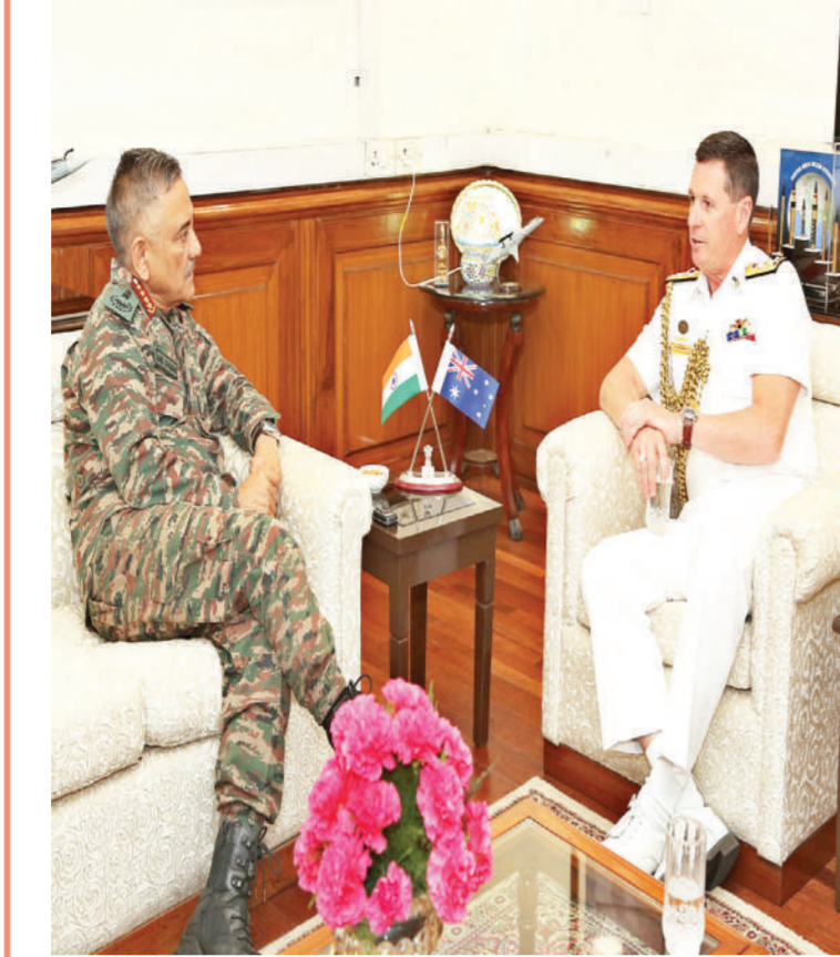
नई दिल्ली। ऑस्ट्रेलिया की नौसेना के प्रमुख वाइस एडमिरल मार्क हैमंड ने बुधवार को नई दिल्ली में सीडीएफ जनरल अनिल चौहान से मुलाकात की। इसके अलावा उन्होंने भारतीय नौसेना प्रमुख एडमिरल आर. हरि कुमार के साथ भी बातचीत की। वाइस एडमिरल मार्क हैमंड नई दिल्ली के साउथ ब्लॉक में नौसेना द्वारा प्रस्तुत रस्मी गार्ड ऑफ ऑनर के साथ स्वागत किया गया।

ऑस्ट्रेलिया के नौसेना प्रमुख भारत की यात्रा पर