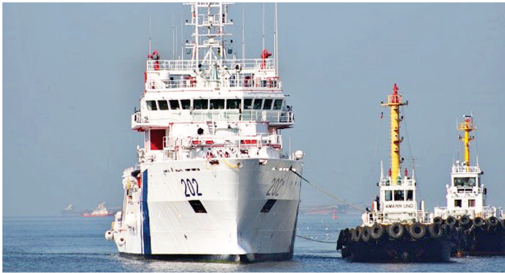
नई दिल्ली। भारतीय रक्षक बल का जहाज समुद्र परहेदार एक विशेष यात्रा पर सोमवार को फिलीपींस के मनीला पहुंचा।