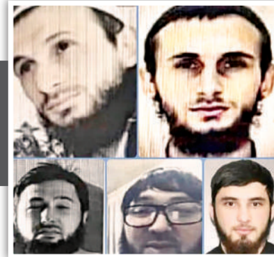
हमले के बाद रूसी एजेंसियों ने इन आतंकीयों की पहचान की है।