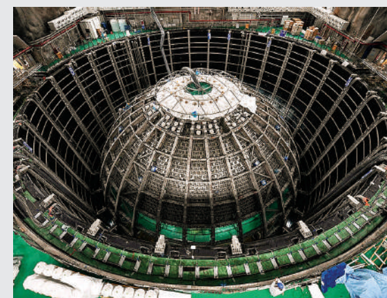
के भाग नहीं होते हैं। फंडामेंटल पार्टिकल्स वे होते हैं जिन्हें और ज्यादा तोड़ा नहीं जा सकता। भले ही न्यूट्रिनोस के बारे में अब चर्चा हो रही है, लेकिन ये कण ब्रह्मांड में बड़े पैमाने पर मौजूद हैं।

आपने स्कूल में पढ़ा होगा कि दुनिया की हर चीज परमाणु (एटम) से बनी है। एटम के केंद्र में न्यूक्लियस होता है, जिसके चारों ओर इलेक्ट्रॉन्स घूमते हैं। न्यूक्लियस के अंदर प्रोटॉन्स और न्यूट्रॉन्स रहते हैं। न्यूट्रिनो और न्यूट्रॉन्स सुनने में भले ही एक जैसे लगते हों, लेकिन इन दोनों में बहुत ज्यादा अंतर है। न्यूट्रिनोस इन सब से बेहद छोटे होते हैं। ये इतने हल्के होते हैं कि काफी समय तक वैज्ञानिकों का मानना था कि इनका मास शून्य है। न्यूट्रिनोस, इलेक्ट्रॉन की तरह फंडामेंटल पार्टिकल्स होते हैं किंतु ये परमाणु