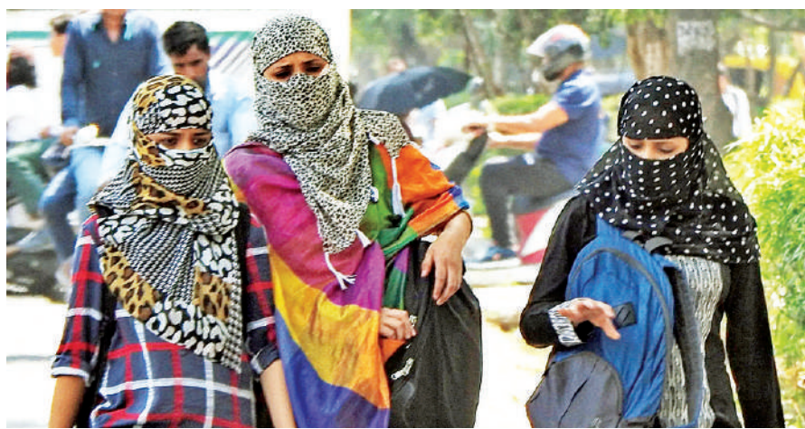
जैसलमेर, जालोर और जोधपुर में दिन में झुलसा देने वाली गर्मी रही। इन जिलों में दिन का तापमान 37 डिग्री सेल्सियस से ऊपर दर्ज हुआ। मौसम विशेषज्ञों के मुताबिक, धुलडी तक यहां तापमान 41 डिग्री सेल्सियस से ऊपर जा सकता है।

बेधड़क। जयपुर प्रदेश में गर्मी ने अपने तेवर दिखाते शुरू कर दिए हैं। खासतौर पर पश्चिमी राजस्थान में अधिकतम तापमान 40 डिग्री सेल्सियस के आसपास पहुंचने लगा है। बाड़मेर, जैसलमेर और जिले में तो गर्मी ने लोगों के पसीने छुड़ा दिए। वहां का तापमान 38 से 39 डिग्री सेल्सियस पर होने लगा है। मौसम विभाग ने आगामी दिनों में तापमान के 40 डिग्री होने की संभावना जताई है। शुक्रवार को प्रदेश के बाड़मेर में पारा 39 डिग्री के पार पहुंच गया। इसी प्रकार विभिन्न जिलों में भी पारे में तेजी देखी गई। बाड़मेर, जैसलमेर, जालोर और जोधपुर में दिन में झुलसा देने वाली गर्मी रही। इन जिलों में दिन का तापमान 37 डिग्री सेल्सियस से ऊपर दर्ज हुआ। मौसम विशेषज्ञों के मुताबिक, धुलडी तक यहां तापमान 41 डिग्री सेल्सियस से ऊपर जा सकता है।