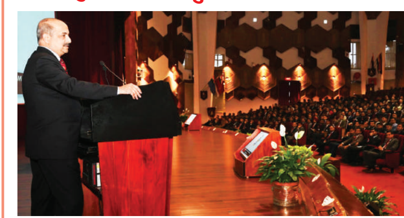
वेलिंगटन। वायुसेना अध्यक्ष एयरचीफ मार्शल वीआर चौधरी ने शुक्रवार को तमिलनाडु के वेलिंगटन स्थित डिफेंस सर्विसेज स्टाफ कॉलेज का दौरा किया और वहां 79वें स्टाफ पाठ्यक्रम के भारतीय सशस्त्र बलों और मित्र देशों के छात्र अधिकारियों को संबोधित किया।