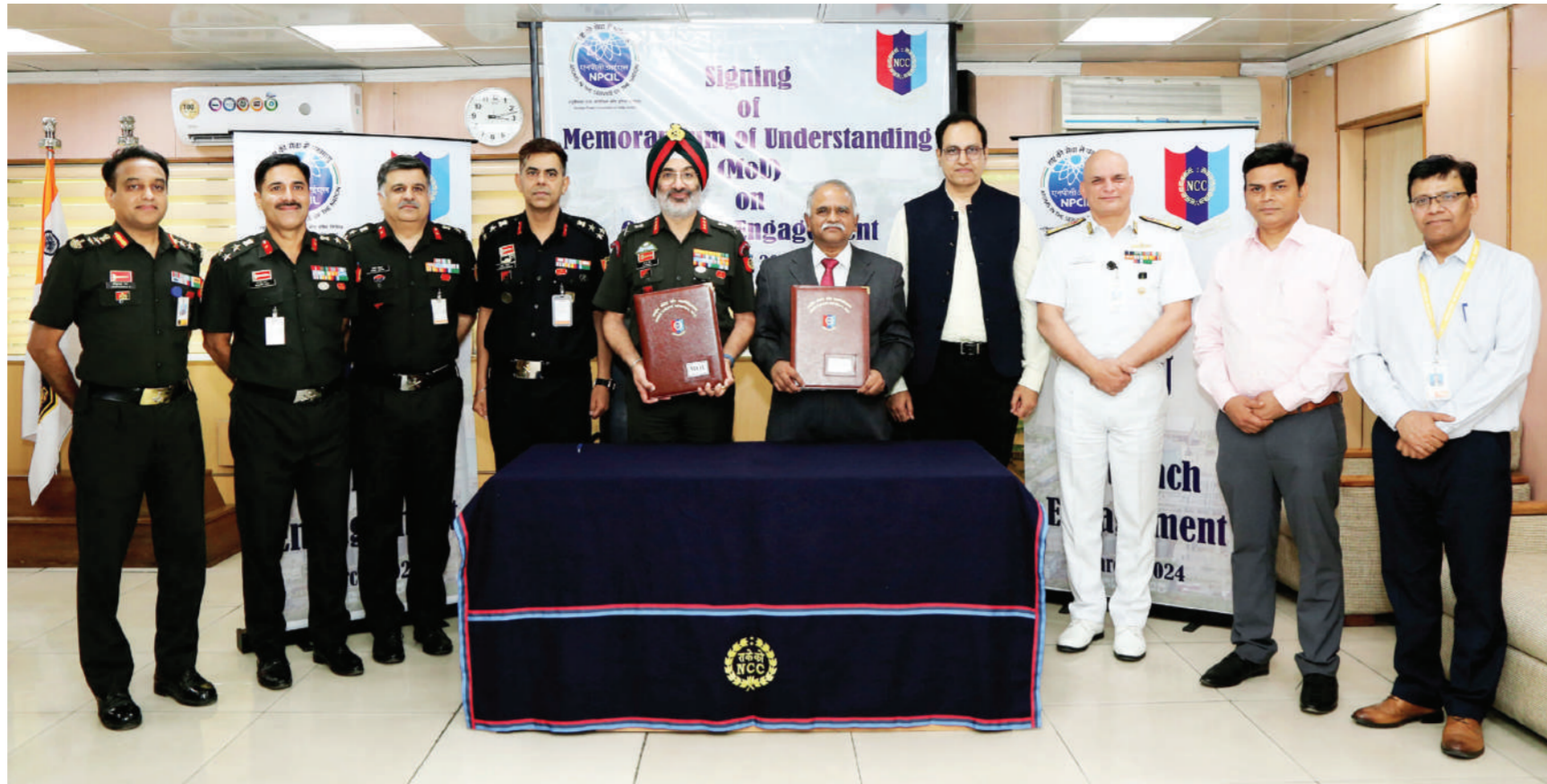
नई दिल्ली। परमाणु ऊर्जा के शांतिपूर्ण उपयोग के लिए लोगों में जागृति पैदा करने के लिए एनसीसी और एनपीसीआईएल ने गुरुवार को नई दिल्ली में एक सहमति पत्र पर हस्ताक्षर किए। इसके लिए विभिन्न कार्यक्रमों का आयोजन किया जाएगा।