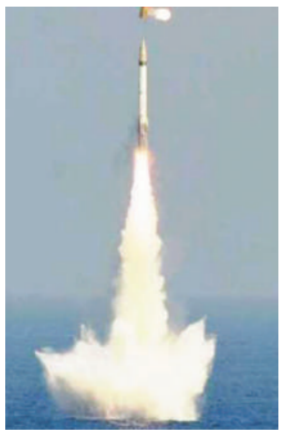
सक्षम है। भारत की ओर चेतावनी जारी किए जाने के साथ ही चीन

भारत पनडुब्बी से लॉन्च की जाने वाली परमाणु मिसाइल के-4 का जल्द परीक्षण कर सकता है। इसकी रेंज 4000 किलोमीटर से अधिक है। इसे वीजिंग किलर मिसाइल भी कहा जाता है। भारत ने बंगाल की खाड़ी में 1680 किलोमीटर क्षेत्र के लिए चेतावनी जारी की है। इस क्षेत्र को 3 और 4 अप्रैल के लिए नो फ्लाई ज़ोन घोषित किया गया है। इससे भारत के मिसाइल परीक्षण किए जाने के कयास लगाए जा रहे हैं। के-4 मिसाइल पारंपरिक वॉरहेड के साथ परमाणु हमला करने में भी