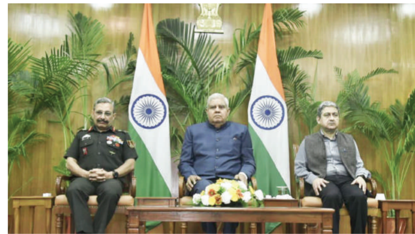
नई दिल्ली। अंतरराष्ट्रीय रणनीतिक वार्ता कार्यक्रम के गुरुवार को नई दिल्ली में उद्घाटन हुआ। इस अवसर पर कई प्रतिभागियों ने उपराष्ट्रपति जगदीप धनखड़ से मुलाकात की।