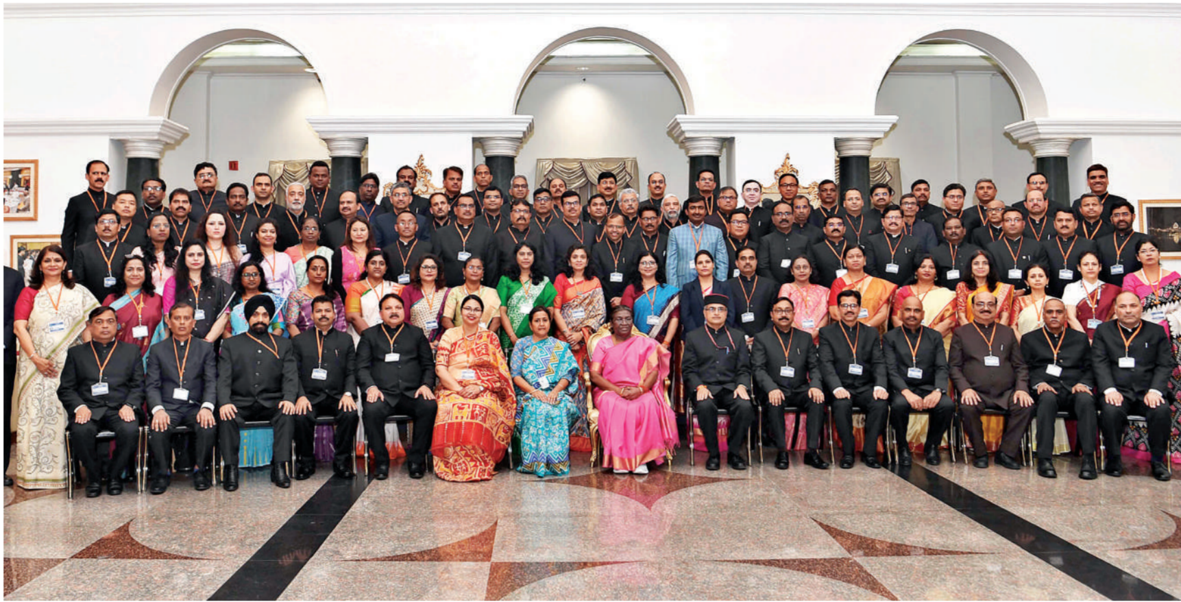
नई दिल्ली। नई दिल्ली में राष्ट्रपति भवन में लाल बहादुर शास्त्री राष्ट्रीय प्रशासन अकादमी (एलबीएसएनए) मसूरी के 125वें प्रवेश प्रशिक्षण कार्यक्रम में भाग लेने आए राज्य सिविल सेवा अधिकारियों ने सोमवार को राष्ट्रपति द्रौपदी मुर्मू से मुलाकात की। इस दौरान मुर्मू ने उनसे कई विषयों पर चर्चा की।