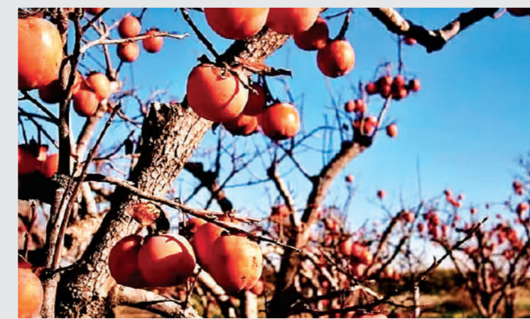
था। बता दें कि आज भारत में हिमाचल प्रदेश, जम्मू-कश्मीर, तमिलनाडु, उत्तराखंड और पूर्वोत्तर में भी इस फल के पीछे बड़ी संख्या में लगाए जा रहे हैं।

पाकिस्तान में पाए जाने वाले इस जापानी फल का रंग हल्का, गहरा नारंगी और लाल रंग है। जो बिल्कुल टमाटर जैसा दिखता है। इस फल का सीजन अक्टूबर से फरवरी तक होता है। बता दें कि कुछ इलाकों में इसे अमलुक तो कहीं रामफल भी कहते हैं। जानकारी के मुताबिक करीब 2 हजार साल पहले पहली बार चीन में इसकी खेती गई थी, जिसके बाद 7 वीं शताब्दी में यह जापान और 14 वीं शताब्दी में कोरिया पहुंचा