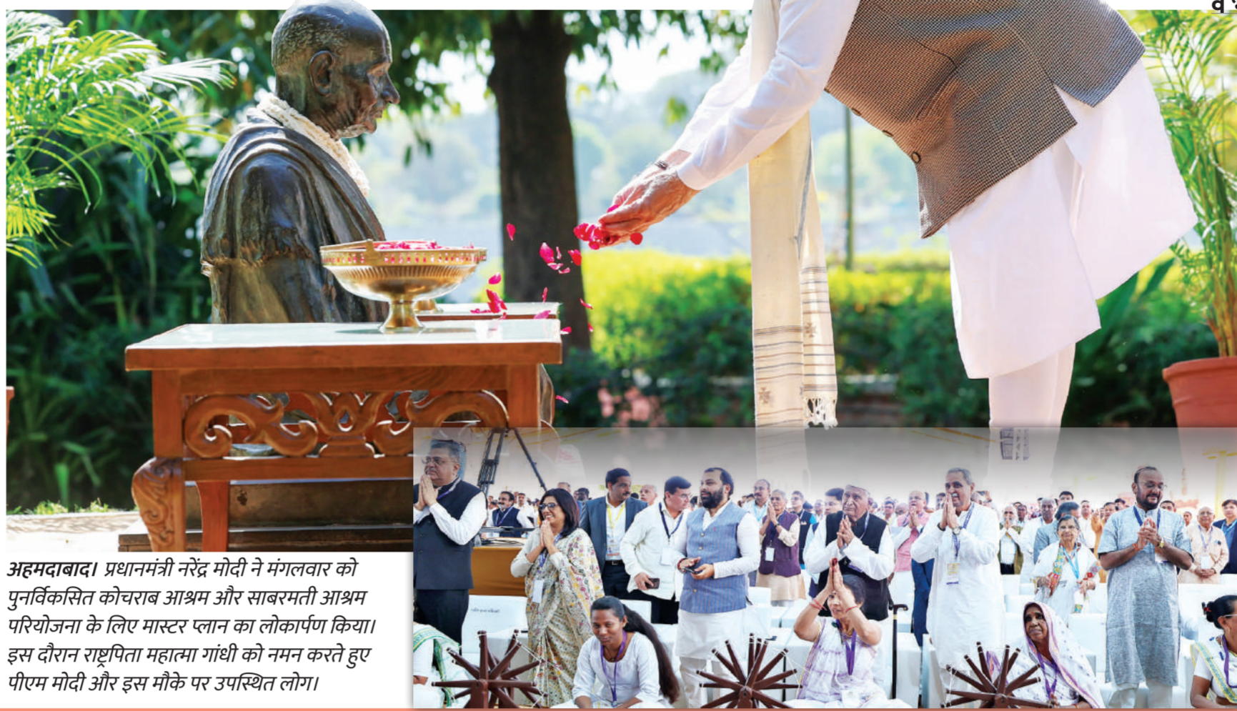
अहमदाबाद। प्रधानमंत्री नरेंद्र मोदी ने मंगलवार को पुनर्विकसित कोचराब आश्रम और साबरमती आश्रम परियोजना के लिए मास्टर प्लान का लोकार्पण किया। इस दौरान राष्ट्रपिता महात्मा गांधी को नमन करते हुए पीएम मोदी और इस मौके पर उपस्थित लोग।