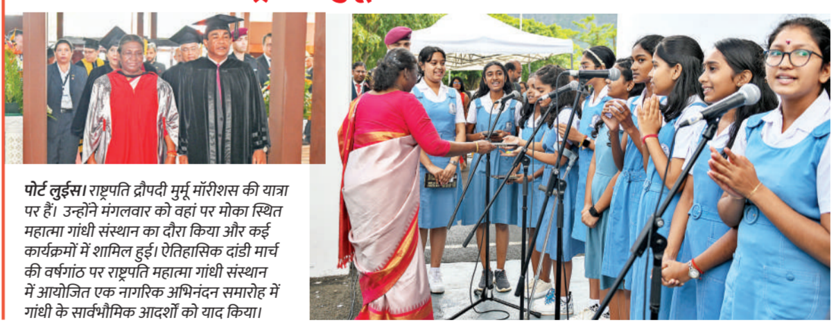
पोर्ट लुईस। राष्ट्रपति द्रौपदी मुर्मू मॉरीशस की यात्रा पर हैं। उन्होंने मंगलवार को वहां पर मौका स्थित महात्मा गांधी संस्थान का दौरा किया और कई कार्यक्रमों में शामिल हुईं। ऐतिहासिक दांडी मार्च की वर्षगांठ पर राष्ट्रपति महात्मा गांधी संस्थान में आयोजित एक नागरिक अभिनंदन समारोह में गांधी के सार्वभौमिक आदर्शों को याद किया।