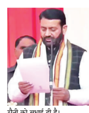
सैनी को बधाई दी है। हरियाणा में नई सरकार का गठन हो गया है। नायब सिंह सैनी

एजेंसी | चंडीगढ़ हरियाणा की राजनीति में मंगलवार को बड़ा उलटफेर देखने को मिला, जहां चंद घंटों के भीतर सरकार बदल गई और बीजेपी ने मनोहर लाल खट्टर की जगह नायब सैनी को मुख्यमंत्री बना दिया। नायब सैनी ने जहां मुख्यमंत्री पद की शपथ ली तो वहीं उनके साथ पांच विधायक भी मंत्री बने।