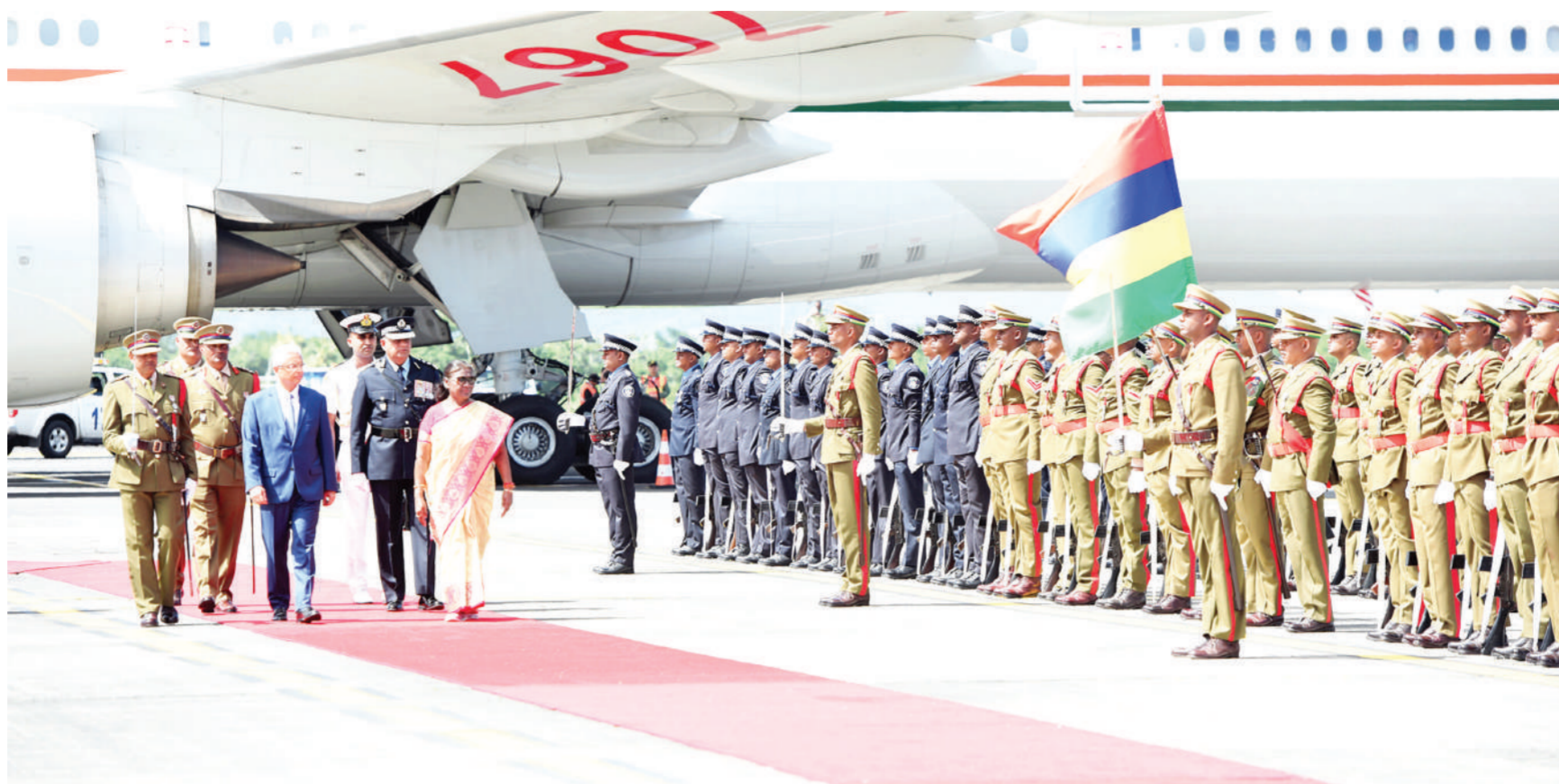
पोर्ट लुईस। राष्ट्रपति द्रौपदी मुर्मू सोमवार को तीन दिवसीय राजकीय दौरे पर मॉरीशस पहुंचीं। राष्ट्रपति मुर्मू मंगलवार को मॉरीशस के राष्ट्रीय दिवस समारोह में मुख्य अतिथि होंगी। पोर्ट लुईस एयरपोर्ट पर राष्ट्रपति मुर्मू का स्वागत करते मॉरीशस के राष्ट्रपति व अन्य नेता।