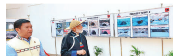
मोदी अरुणाचल प्रदेश का दौरा करते हुए।

चीन ने सोमवार को कहा कि प्रधानमंत्री नरेन्द्र मोदी के पिछले सप्ताह अरुणाचल प्रदेश का दौरा करने को लेकर उसने भारत के समक्ष राजनयिक विरोध दर्ज कराया है। चीनी विदेश मंत्रालय के प्रवक्ता ने कहा कि भारत के इस कदम से सीमा विवाद और जटिल