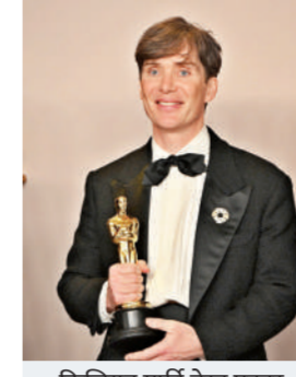
किलियन मर्फी बेस्ट एक्टर

इस बार नॉमिनेशन में सबसे ज्यादा जलवे ओपेनहाइमर के हैं। किलियन मर्फी स्टारर फिल्म को 13 कैटेगरी में नॉमिनेट किया गया है। पुअर थिंस को 11 नॉमिनेशन मिले हैं। इसके अलावा बाबॉ और किलर्स ऑफ द फ्लावर मून समेत कई फिल्मों को नॉमिनेट किया गया है। भारतीय मूल की केनेडियन फिल्ममेकर निशा पाहुजा की टू किल ए टाइगर ऑस्कर में नॉमिनी है। सभी सितारों ने रेड कार्पेट पर जलवा बिखेरना शुरू कर दिया है। ओपेनहाइमर स्टार किलियन मर्फी से ड्यून 2 की जैडया तक ने अपने स्टेजिन लुक से रेड कार्पेट पर ग्लैमर का तड़का लगाया है।